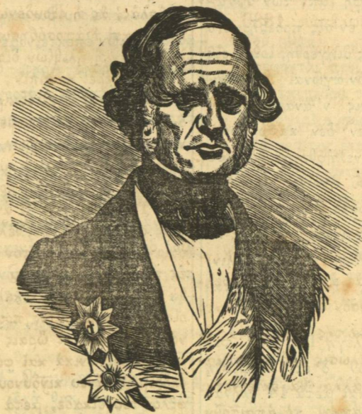
A. P. ΡΑΓΚΑΒΗΣ.

Ἐλθὼν εἰς τὴν Ἑλλάδα, μετὰ τὸ τέλος τῆς ἐπαναστάσεως, παρητήθη τοῦ στρατιωτικοῦ σταδίου καὶ ἰδιώτευεν· ὅτε δὲ συνέστη τακτικὴ κυβέρνησις ἐν Ναυπλίῳ, ὁ Ἰάκωβος Ρίζος, διορισθεὶς τότε ὑπουργὸς τῶν ἐκκλησιαστικῶν καὶ