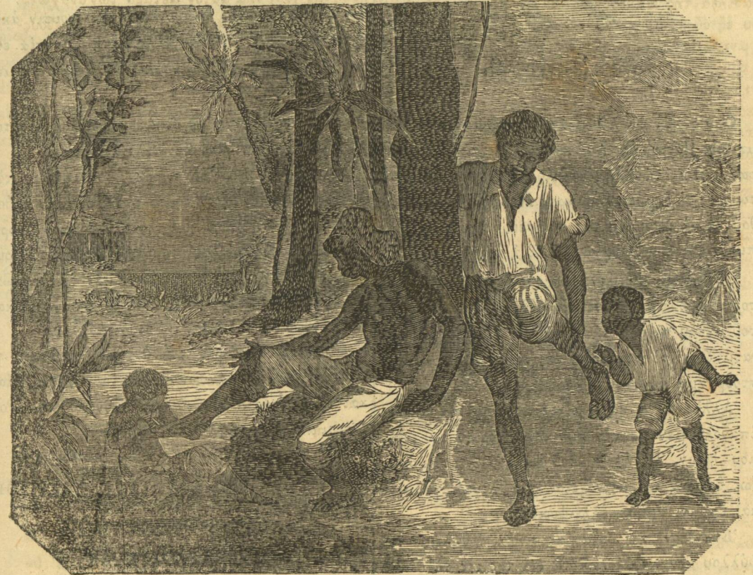
Οἱ μαῦροι τῆς Βραζιλίας καὶ οἱ μικροὶ αὐτῶν ποδιατροί.

α Πρὸ δεκαπενταετίας, λέγει, πᾶς κάτοικος τῶν Παρισίων ἠδύνατο νὰ ἴδῃ ἀνέτως ἐπὶ τῆς