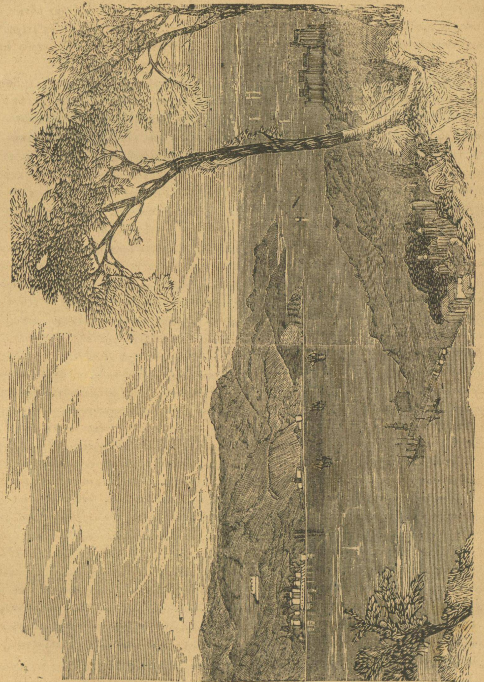
ΤΟ ΠΑΡΑ ΤΟΝ ΕΥΓΕΙΝΟΝ ΠΟΝΤΟΝ ΣΤΟΜΙΟΝ ΤΟΥ ΒΟΣΠΟΡΟΥ. (Ἴδε σελ. 154)