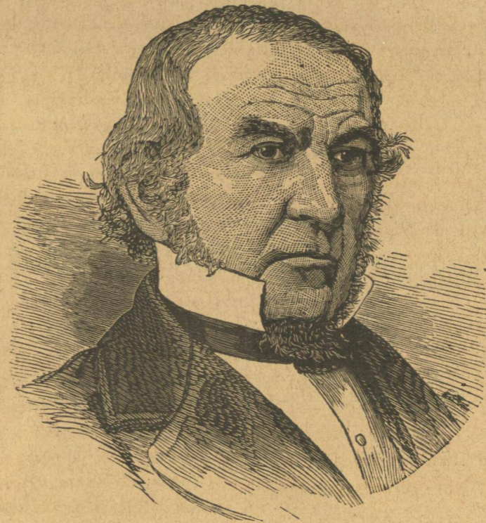
Ὁ νέος πρωθυπουργὸς τῆς Ἀγγλίας κ. ΓΛΑΔΣΤΩΝ.

Οὐδεὶς ἠδύνατο νὰ ἀμφιβάλλῃ περὶ τούτου. Ἡ βασίλισσα τῆς Ἀγγλίας οὐδέποτε παρεκτράπη τῶν μεγάλων συνταγματικῶν ἀρχῶν, αἵτινες εἰσιν ἡ ἀρχὴ καὶ ἡ δύναμις τοῦ ἄγγλικῶ πολιτικῶ συστήματος. Δυνάμεθα νὰ εἴπωμεν ὅτι νέα ἐποχὴ ἀνατέλλει σήμερον διὰ τὴν Ἀγγλίαν. Ἡ ὑπὸ τοῦ ἐξόχου τούτου πολιτικοῦ παραδοχῆ τῆς πρωθυπουργίας καὶ τοῦ Ἰπουργείου τῶν Οἰκο-