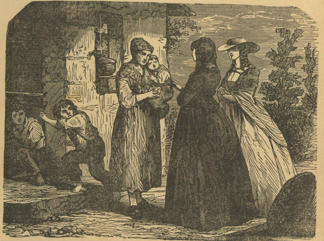
Ἡ Αὐτοκράτειρα Ἐπισκεπτομένη τοὺς Χωρικοὺς.

θὰ εἰσέλθωμεν εἰς τὴν νῆσον τῆς Κρεστόφκης, τὴν μεγαλητέραν πασῶν, καὶ ἰδιοκτησίαν τῶν πριγκίπων Βελο σέβσκι. Ἐνταῦθα εἶναι τὸ προσφιλὲς τοῖς Γερμανοῖς τεχνίταις καὶ τοῖς Ρώσσοις ἐμπόροις συνεντευκτήριον. Οἱ πρῶτοι πλημμυροῦν τὰ ξενοδοχεῖα, ἐσθίοντες, καπνίζοντες, πίνοντες εἰς τὸν ἤχον θορυβώδους στρατιωτικῆς μουσικῆς, οἱ ἕτεροι στρώνονται μετ' ἀφελείας ἐ-