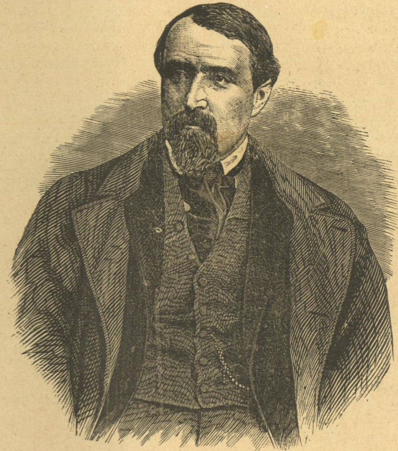
ΒΕΛΧΕΑΜ ΠΡΕΣΣΕΛ, Διάσημος Γεωμέτρης τῆς Βυρτεμβέργης.

πάν ὅ,τι τῷ εἶπε διὰ φωνῆς ἀσθενοῦς μὲν, καθαροῦ ὅμως καὶ ἀταράχου. Ἀφοῦ δὲ τῷ ἀνεκεφαλαίωσε πάν ὅ,τι ἐσχεδιάσιν ποτε περὶ τῆς μεταναστάσεως αὐτῆς εἰς ἄνθερος καὶ περὶ τῶν μέστων τῆς ἐκτελέσεως.