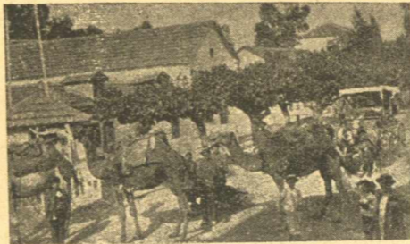
Ἡ ΑΠΟΙΚΙΑ ΡΙΣΟΝ-ΔΕ-ΣΙΩΝ