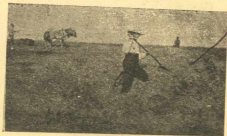
Ἡ ΑΠΟΙΚΙΑ ΡΕΧΟΒΟΘ

20) Μιλχαμά. 10000 δουνάμ. ἔκτασιν. Αἱ τρεῖς αὗται ἀποικίαι ἰδρυθεῖσαι ὑπὸ τῆς Ἐταιρείας «I.C.A.» σχηματίζουσι σύνολον 605 κατοίκων.