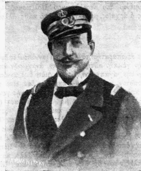
Ἡ Α. Β. Υ. Ὁ Πρίγκυψ Γεώργιος

Τὸ ἔργον λοιπὸν τοῦ Γιαννοπούλου εἶναι Ἐ ρ γ ο ν. Διαφέρει πολὺ ἀπὸ ἐκεῖνα ποῦ προκαλοῦν ἕνα πρόσκαιρον θόρον, τεχνητόν, διότι ἔχει ἐντὸς του ἑλα τὰ στοιχεῖα διὰ νὰ ζ ἢ σ η. Καὶ ὅπως τὸς δάλλει τὰς ἰδέας μετὰ τὸ νευρώδες του ὕφους, ὅπως τὰς ἐγκαράττει εις τὸν νοῦν τοῦ ἀναγνώστου ὡς διὰ πυρωμένου σιδήρου, ἀδύνατον εἶναι νὰ μὴν εὐρη, ἀργὰ ἢ γρήγορα, προσηλύτους, ἀδύνατον νὰ μὴ χρησιμοποιήσῃ μίαν ἡμέραν ὡς Ὀδηγός. Νομίζω διὰ τοῦτο ὅτι τὸ καθῆκόν μας, πρὸς τὸ παρόν, εἶναι νὰ τὸ προσεξώμεν πολὺ, νὰ τὸ μελετήσωμεν, — καὶ ἀργότερα, ὅπου τυχὸν δὲν μᾶς ἀρέσῃ, νὰ τὸ πολεμήσωμεν.