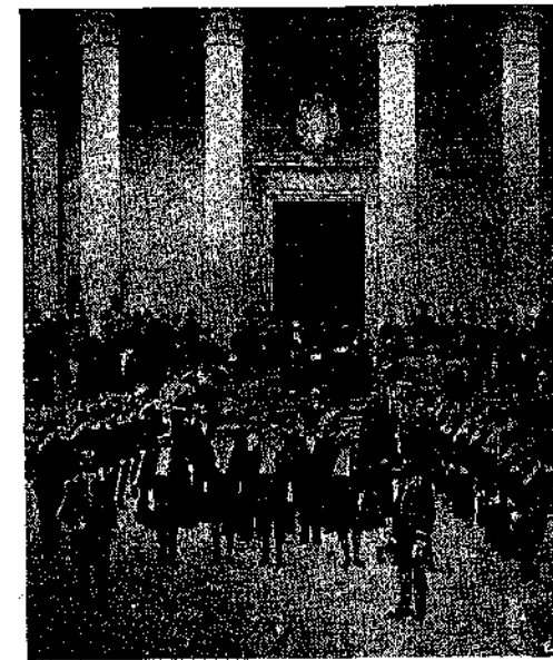
Επίσημος χορτή έν άγίῳ Μαρίνῳ.

dicale μόνον πέντε φύλλα έν έτει 1889 ήδυνήθη να εκδώση. Τό γε νύν ούδεμία έφημερίς εκδίδεται, τὸ δέ τυπογραφείον χρησιμεύει προς εκτύπωσιν τών νόμων, τών κυβερνητικών διαταγμάτων ή άλλων ιδιωτικών εργασιών!