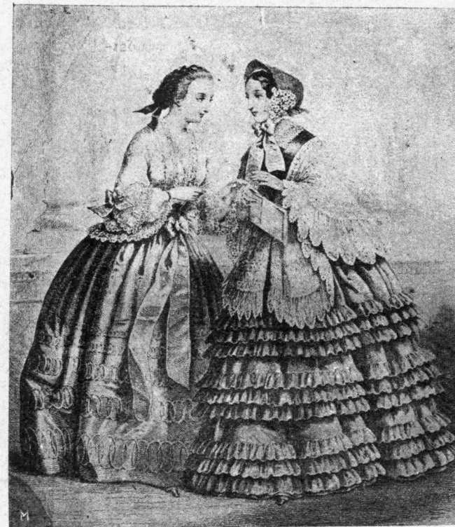
Ἡ ΓΕΛΟΙΑ ΜΟΔΑ ΤΗΣ ΑΥΓΙΟΝ

Πλὴν τῶν ἐν Ἑλλάδι ἐνεργηθειῶν ἐνεργειῶν τοῦ Συνδέσμου, αἱ Ἑλληνίδες ἀντιπρο-