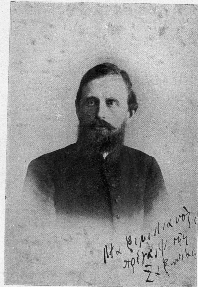
Ὁ συνήγορος τῶν Κρητικῶν δικαίων ΠΡΙΚΗΨ ΜΑΣ ΤΗΣ ΣΑΞΩΝΙΑΣ

ἀφήστε με στὸ μνήμα τῆς γυναίκας ποῦ τὴ γλυκοτραγοῦδησα, ὅταν εἶμουν ἀγόρι δεκοχτῶ χρονῶν, νὰ στήσω τὸ μυρολόι.