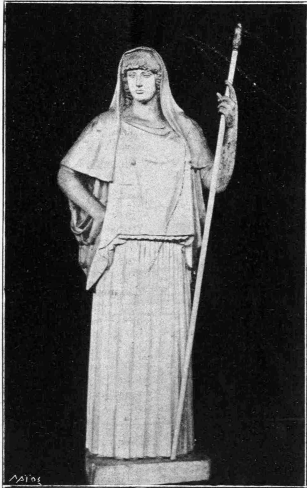
Ἡ Σωδάνδρα τοῦ Καλάμιδος