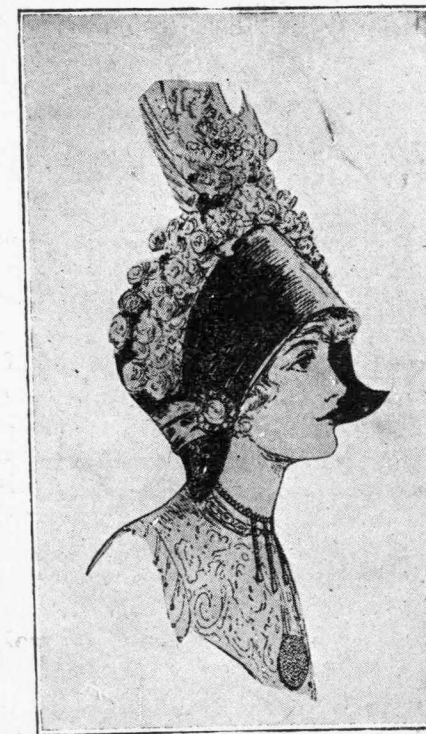
Ἡ τελευταία μὸδα τῶν καπέλων.

Εἶνε ἡ ὥρα τώρα νὰ χωρισθοῦν. Τὸ χάρμα προχωρεῖ, τὰ πουλιὰ πετοῦνε ἀπὸ κλαδί, σὲ