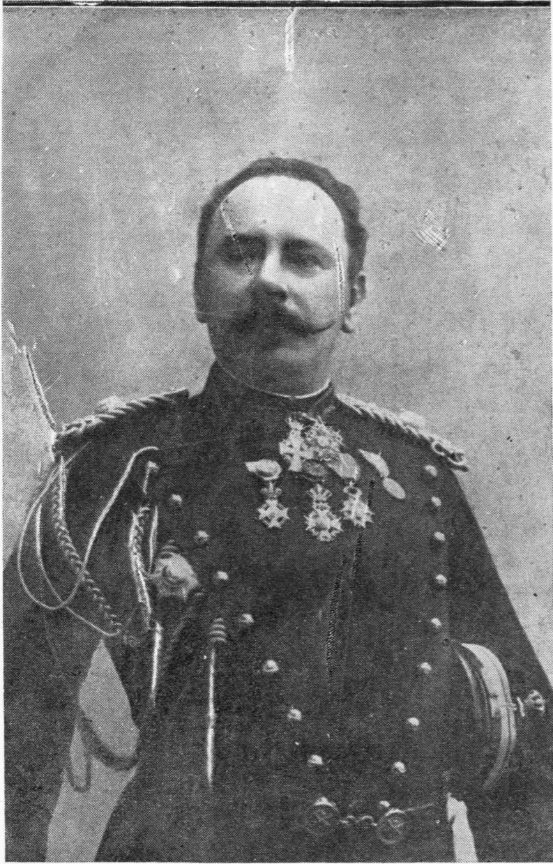
Ο κ. Κ. ΣΑΠΟΥΝΤΖΑΚΗΣ ΑΡΧΗΓΟΣ ΤΟΥ ΣΤΡΑΤΟΥ ΗΠΕΙΡΟΥ

Οὐρανός καὶ λίμνη πέρα στὴν ἄκρη συνεχέοντο, καὶ ἐφαίνοντο ἓνα, τυλιγμένα σὲ ἄσπρα ὑπερκόσμια πέπλα. Μόνα τὰ λιμνοπούλια ἦτανε χαρούμενα, καὶ ἔπαιζαν χίλια παιγνίδια στὴν ἐπιφάνεια τοῦ νεροῦ. Ἦσυχια... καμμία ζωή... ἓνας ὕπνος ξαπλωμένος στὰ πάντα.