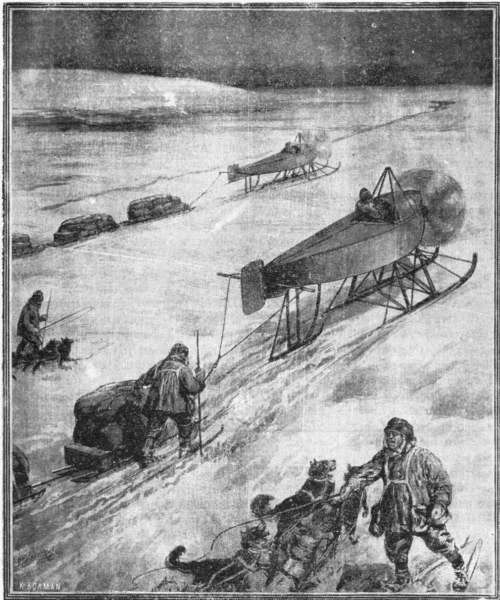
Κίνησις ἐλκύνθρων εἰς τὸν Νότιον Πόλον.