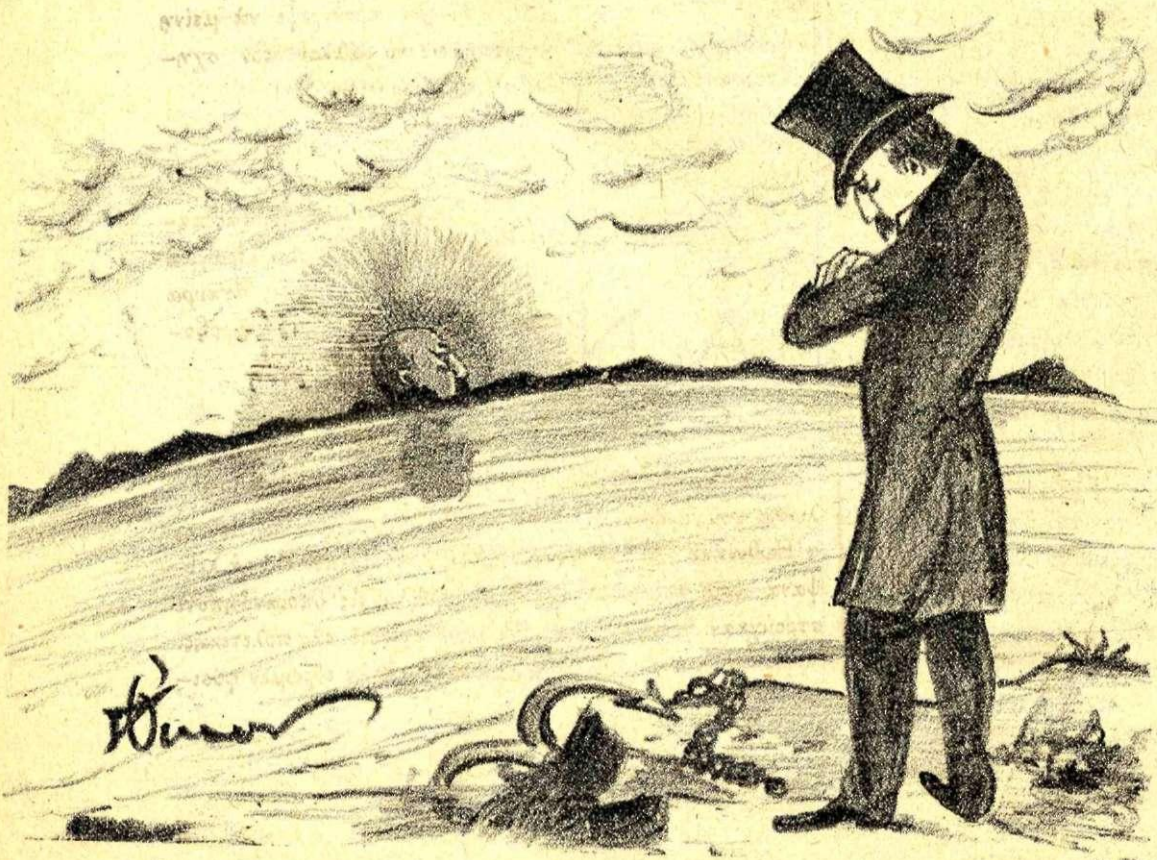
Ἡ δύσας του.