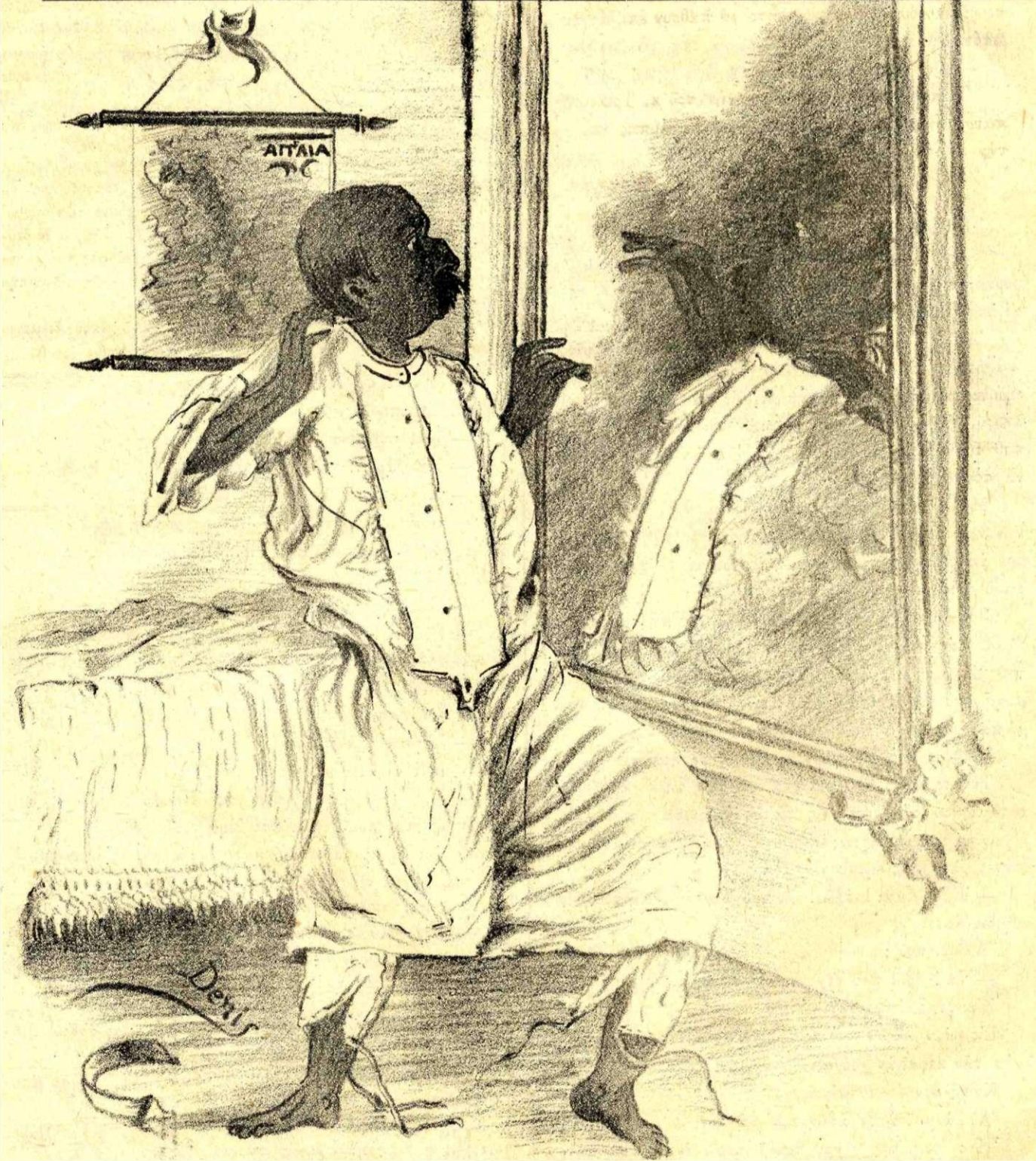
Πρὸ τοῦ καθρέπτου του (κατὰ τὴν πρῶταν τῆς 17ης Ἀπριλίου)