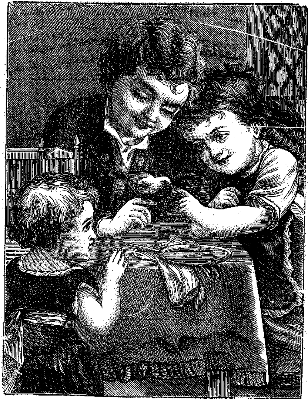
Ἀπὸ ποῦ ἦλθεν;

Καὶ ὅμως αὐτὰ εὐσυνειδήτως ἐξεπλήρωσαν τὸ χρέος των ζητοῦντα ὅσας ἠδύνατο πληροφορίας.