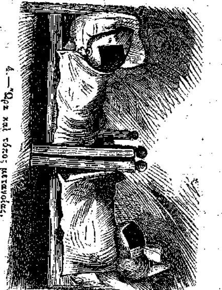
4.—Ὁρα καὶ τόσος μεταβολῆς.