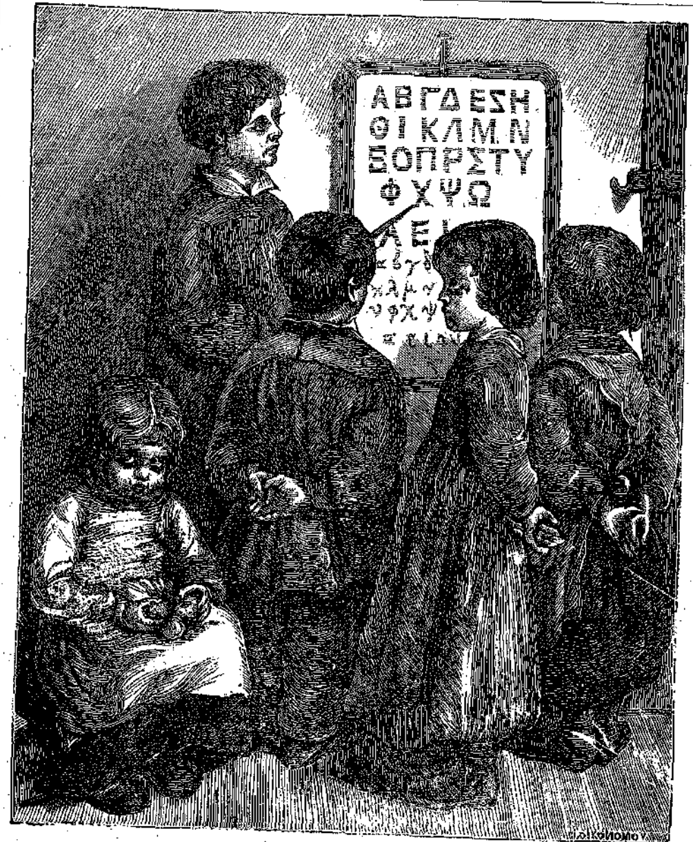
Ὁ μικρὸς διδάσκαλος.

Μολοντί τὸ δέσμα μας φαίνεται λεῖον καὶ ἀρκοῦντως πυκνόν ὥστε νὰ ἐμποδίσῃ τὴν ἐκροὴν τοῦ αἱματός μας, ἐν τούτοις ὁ μὲν ἔχει πολλὰς μικρὰς ὅπας ἀδιοράτους, τὰς ὅπας καλοῦμεν πόρους τοῦ δέσματός καὶ διὰ τῶν ὅπιων τελεῖται ἡ διαπνοή,