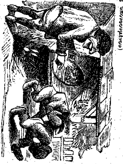
2.—Ἐἰ καὶ παληοτάτω μου, τί ἔπαθε αὐτοῦ τόσος!

ΙΣΤΟΡΗΜΑΤΙΟΝ (μετὰ διδάγματα ἐθνολογίας ἠθολογίας)