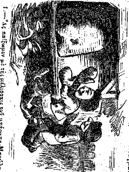
1.—Ὡς καί ποτεν μετ' ἡμῶν τῶν μικρῶν Μανώλη.