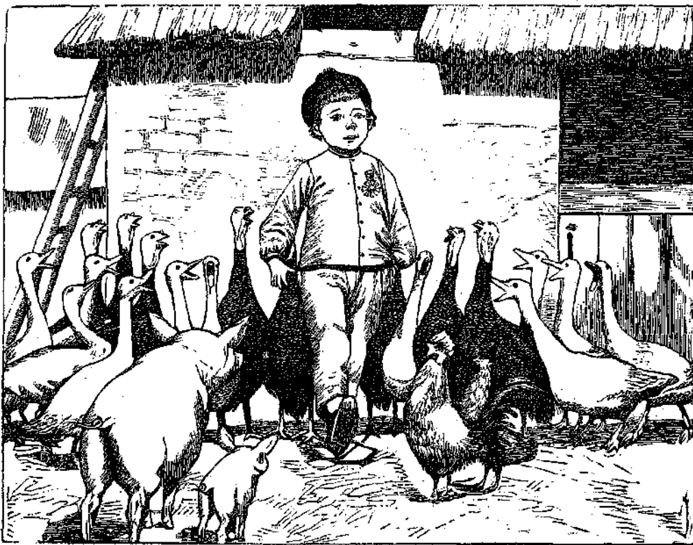
ΟΛΟΙ ΕΜΕΙΝΑΝ ΕΚΘΑΜΒΟΙ, ΕΚΣΤΑΤΙΚΟΙ, ΘΑΥΜΑΖΟΝΤΕΣ ΤΟ ΠΑΡΑΣΗΜΟΝ ΤΟΥ ΚΥΡΙΟΥ ΤΩΝ!

τήν μεγαλοπρέπειαν τὸ παράσημόν του εἰς τὸ στήθος του.