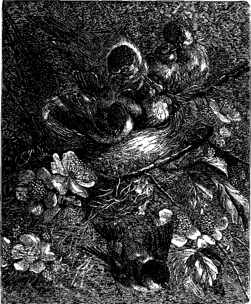
Η ΠΡΩΤΗ ΠΤΗΣΙΣ