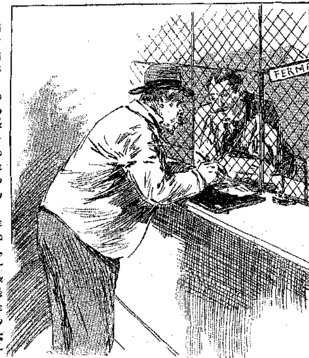
«Έπηρε την πένναν...» (Σελ. 221, στ. β'.)