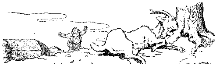
«Την είδε να ξεφυλά κοντά σε μιαν ελιά...» (Σελ. 220, στ. α'.)