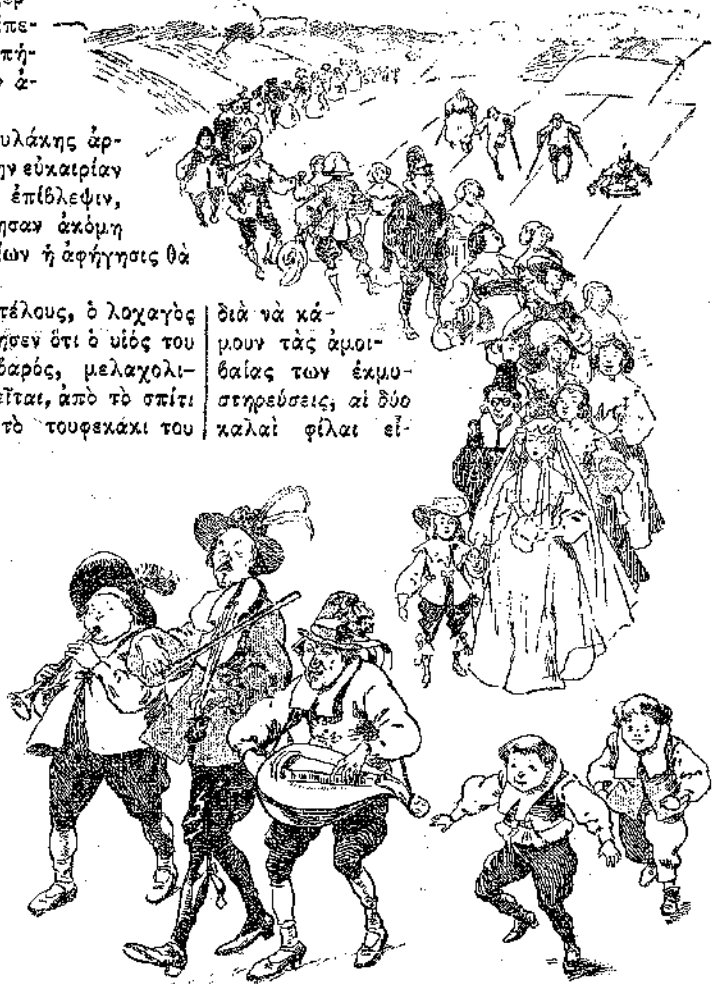
«Ὁ γάμος ἐγινε μὲ μεγάλην κομπήν...» (Σελ. 390 στ. 6')

Ὅσον ἐπερνοῦσαν τὰ χρόνια, τόσο ἡ Ροζέττα ἐγένετο κόρη μὲ ὄλες τῆς χάρες, καλῆ καὶ χαριτωμένη. Δὲν ἦτο ὁμοῦς μόνῃ ἐκεῖ. Τὴν συνώδευσεν ἡ φιλενάδα της, ἡ Βαθίλδα. Καὶ διὰ τὴν μίαν καὶ διὰ τὴν ἄλλην, ὑπῆρχαν σχέδια γάμου εἰς τὸν αἴρα, καὶ ἀκριβῶς,