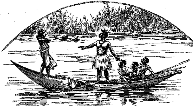
«— Η σειρά σας τώρα να έργασθητε και να με πείτε εκεί που θέλω!... (Σελίς 150, στ. γ'.)