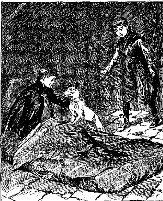
«Εἶνε γιὰ μένα; . . . Εἶνε δικὸς μου; . . .» (Σελ. 405 στ. γ')

— Ἐννοεῖται πῶς εἶνε δικὸς σου! Τὸν εὔρηξα στὸ δρόμο, ἀπέξω ἀπὸ ἕνα παληόσπιτοκαμμένο, ὅπου ποῖς ἔφερε ποιά κακὰ παιδιὰ τὸν εἶχαν δέσῃ. Νάβλεπες πῶς μ'ἐφίλησε ὅταν τοῦ ἔκοφα τὸ σχοινί ποῦ τὸν ἐπνιγε! Λές καὶ ἤθελε νὰ μοῦ πῆ εὐχαριστιῶ. Ἐπειτὰ ἔλαμε νὰ μὲ ἀκολουθήσῃ. Ἐπειδὴ ὅμως τὸν εἶχαν κτυπήσῃ καὶ ἦταν μάτωμένος, ἐκἀτάλαβα πῶς θὰ πονοῦσε καὶ τὸν πῆρα στὰ χέρια. Ἔτσι τὸν ἔφερα ὡς ἐδῶ γιὰ νὰ σοῦ τὸν χαρίσω. Εἶς' εὐχαριστημένος, Ἀνδρῖκο μου;