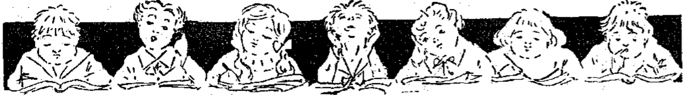
Σελίς Συνεργασίας Συνδρομητών