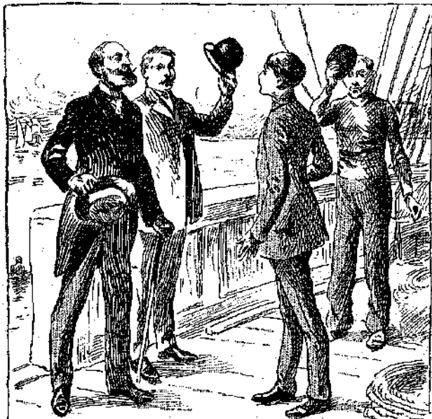
«Ἐχομεν τὴν τιμὴν νὰ ὀμιλῶμεν πρὸς τὸν κόμητα (Ριονσαί; Σελ. 301 στ. γ'.)

Παρουσίας τὸ τηλεγράφημα ἀνοικτόν ὁ Πέτρος ἀνέγνωσε: