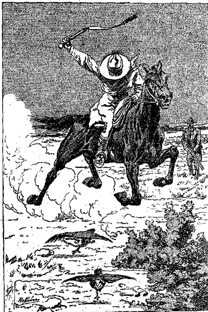
«Ἐκτύπωσε κατ' αὐτὸν τὸν τρόπον καμικὰ εἰκοσαριὰ πέρδιες...» (Σελίς 262, στ. 6.)

—Μὴν παίξης, παιδί μου, ποτέ ! Ἐγὼ εἰμι ἐμπρὸς σου ἕνα θῦμα τοῦ σοφιστοῦ αὐτοῦ πάθους ποῦ λέγεται χαρτοπαίξιον. Ἡμῶν πλοῦσιος, ἀπὸ καλῆ οἰκογένεια μὲ ἀρκετὴ μέρωσι, ποῦ κατ' ἐμποροῦσα νὰ κἀμω καὶ ἐγὼ ἐστὶ Παρίσι. Ἐπαίξα καὶ τόχατα ἔλα. Ἀνομιὰ σθῆκα νὰ ἔλθω ἐξῶ καὶ νὰ φουτώω μ' αὐτοὺς τοὺς Ἴνδοὺς ποῦ μὲ κλέβουν αἰ-