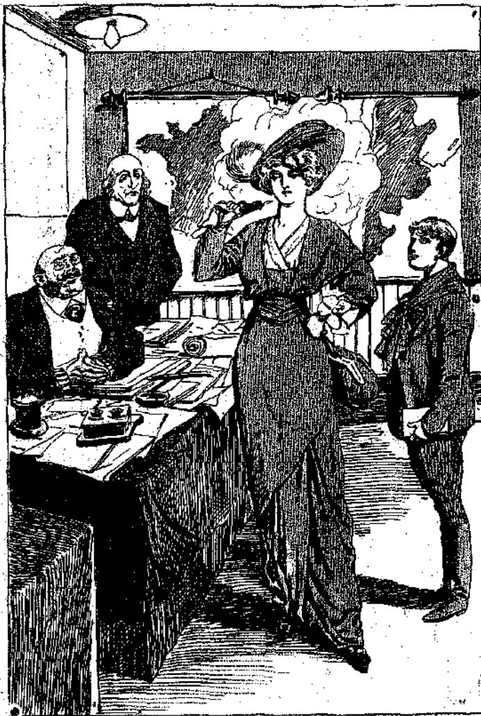
Ἡ μίς Μπριδζ ἐπυροβόλησεν ἑπάνω ἀπὸ τὸν ὠμόν τῆς... (Σελ. στ. 397 γ.)