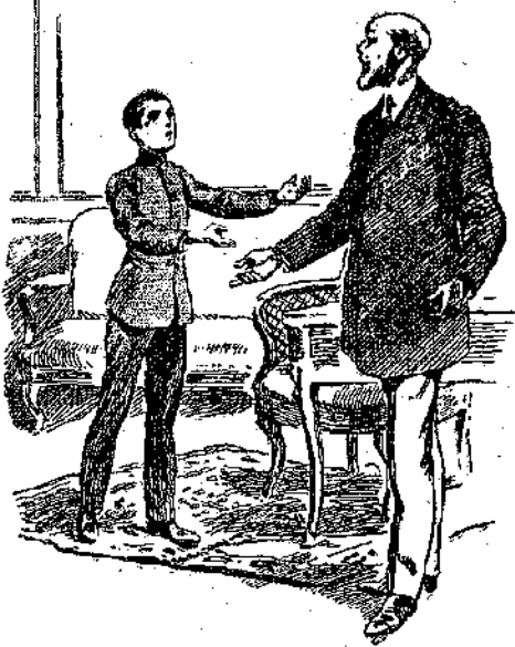
«Μά, κύριε Διευθυντά, τί συμβαίνει λοιπόν; . . .» (Σελ. 13 στ. γ.)

Καὶ ἀποτεινόμενος πρὸς τὸν Ἑρρίκο, προσθέτει: