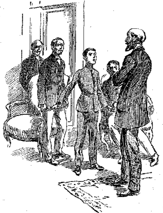
«Ο μπαμπάς δεν είναι κλέφτης.»

του και άπρόσπεθηκε λίγο, ρώτησε: — Κύριε Φρανσής, την ώρα που έφυγε ο Σομώ, είδατε άνύπηρχαν τα χρήματα στα κουτιά;