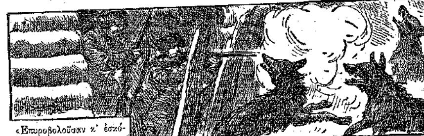
«Ἐπιπροβόλουσαν κ' ἐσκότουσαν πολλούς...»

Ἰστερα ἐπῆρε τὸν δρόμον νὰ ἐπιστρέψῃ εἰς τὸν πύργον του, μολοντὶ οἱ φίλοι του τὸν ἐμπόδιζαν, λέγοντες ὅτι