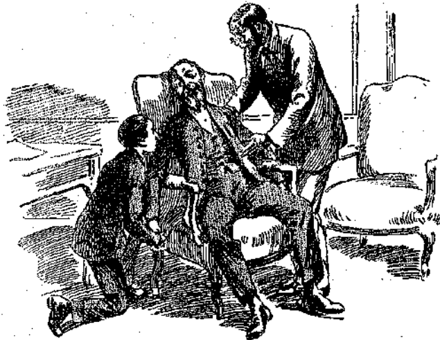
«Καὶ τώρα κάθηται σὲ μιὰ πολυθρόνα, ἐντελῶς ἀδιάφορος πρὸς τὰς περιποιήσεις...» (Σελ. 13 στ. 6.)

— Σομῶ, τοῦ ἔλεγε ὁ προϊστάμενός του μὲ σοβαρότητα, ἀλλὰ καὶ μὲ γλυ-