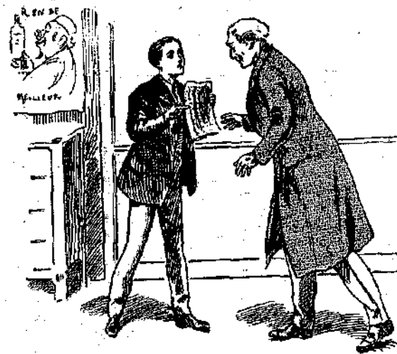
«Μ' αυτά όλα συνδυάζονται θαυμάσια!» (Σελ. 182, στ. β')

Εύτυχώς, ο θυρωρός, μισοξυπημένος άπο το κουδούνισμα, τράβηξε τς σχοινί της πόρτας και ξανάπεσε να κοιμηθή, χωρίς να ρωτήσει ποιοι ήταν. Έτσι ά- νεγόχλητοι, ο Καντινιώ κι ο Έρρίκος άνέβηκαν, άνοιξαν με τς ένα κλειδί την