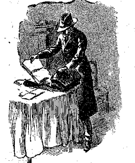
«Ο Άγκλάς, με φόβου, άρχισε να ρίχνη χαρτιά 'ς ένα μεγάλο χαρτοφυλάκιο...» (Σελ. 173, στ. α.)

Ο Καντινιώ δεν έτκέραθη καθόλου να γελήσει μ' αυτή την τόλμηρή διαβεβήσι. Μήπως ο μικρός ήθοποιός, μονάχος του, δεν ανέκαλιψε ως τώρα τόσα πράγματα και δεν άνάγκασε τον καικόβρογο να τραπή εις φυγήν; Καθόλου άπίθανο λοιπόν να εύρισκε και την άπίδειξι: που χρειαζέτο, τώρα μάλιστα