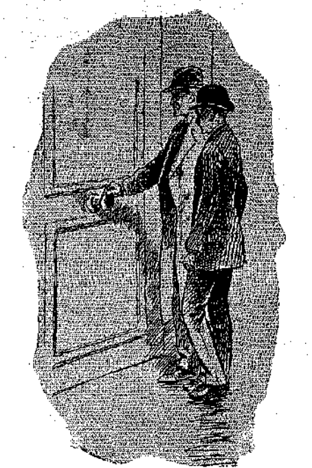
«Ήταν μεσάνυχτα, όταν έβασαν στο μεγάλο σπίτι...» (Σελ. 181, στ. γ.)

Ο μικρός εξηγήθηκε. Μιά μέρα, στο σπίτι του, είχε άκούση κάποια συνομιλία μεταξύ της αδελφής του και