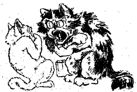
«Και έκραυνοβόλησε μ' ένα βλέμμα τς δυ- σταχή Άσπροούλη!»