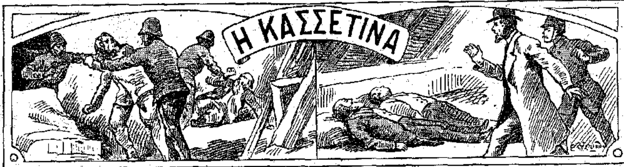
ΚΕΦΑΛΑΙΟΝ Γ' (Συνέχεια).

— Σκύβε, φίλε μου, σκύβε πολύ. Σούρου, καλλίτερα, κατά γης. Οι ληστές, αν παραμυνούν κάποιον να μās κτυπήσουν στα σκοτεινά, θα σκοπεύσουν βέβαια κατά συμπερασμόν, στο στήθος. Αλλά η σφαίρες τότε θα περάσουν άπάνω από τα κεφάλια μας. Σκύβε, φίλε μου, τύρου, όπως κ' εγώ.