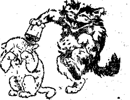
«Στάσου! να τς δώρο σου!»

Και άρχισε να κάμη στς γυίο της ή κυρά - Κακινότριχη, ότι και αυτός έκανε προτήτερα εις τς... «άκατεών». (Παράφρασις) ΕΚΤΑΚΤΟΣ