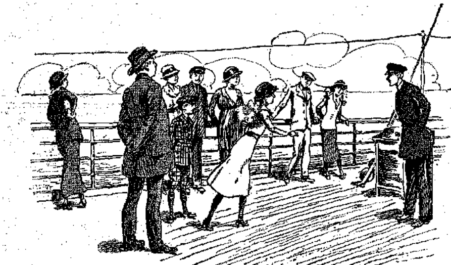
Ἐπαίξε στὸ κατάστρωμα διάφορα παιγνίδια... (Σελ. 191, στ. 6.)

ἀρχισε νὰ παίρνῃ θάρρος καὶ νὰ συλλογίζεται διαφρητικὰ.