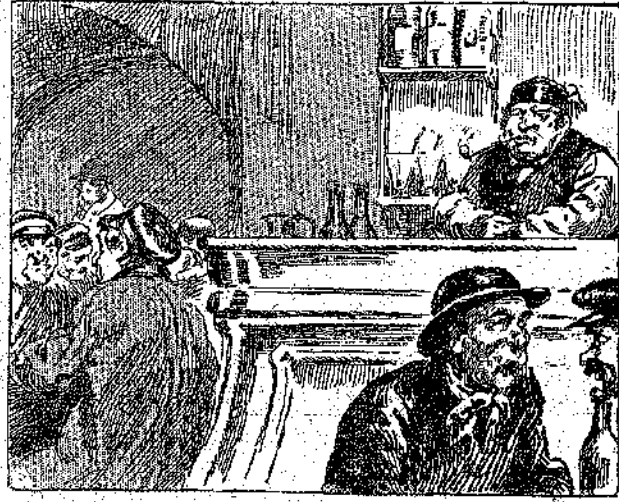
«Σὲ μιὰ γωνιά ἔλιμπε ἕνα παλῆριο τεζάι...» (Σελ. 82, στ. γ')

ταβερνιάρης ἐπίασε τὸν Φρέδο ἀπὸ τὴ μέση καὶ τὸν πέταξε σὰν τόπι σ' ἕναν ἀσχημον ἀνθρώπο· αὐτὸς τὸν πέταξε σ' ἕναν τρίτο καὶ πᾶει λέγοντας. Περιστὸ νὰ ποῦμε πὺς τὸ παιγνίδι πού βρῆκαν οἱ βάρβαροι αὐτοὶ μεκρηθες, δὲν ἦταν ἀκίνδυνο γιὰ τὸ παιδί, πού χτυποῦσε στὰ τραπέζια καὶ στὰ πάτωμα ἀκόμη. Ἄραγε αὐτοὶ οἱ ἀνθρώποι, ἐρεθισμένοι ἀπὸ τὴν ἰδέα ὅτι εἶχαν νὰ κάμουν μ' ἕναν ἀστυνομικὸν κατάσκοπο, θὰ σταματοῦσαν προτοῦ τὸ παιδί πάθαινε τίποτα σοβαρό: