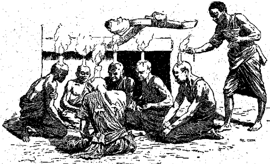
«Ἐξακολουθοῦσαν τοὺς ψαλμούς των...» (Σελ. 254, στ. γ')

— Δὲν ὑπάρχει λόγος ν' ἀνησυχῆτε γιὰ τὰ παιδιά. Ἀπὸ τὴ στιγμή αὐτῆ, ἐγὼ τὰ παίρνω ἀπάνου μου, θὰ μὲ-