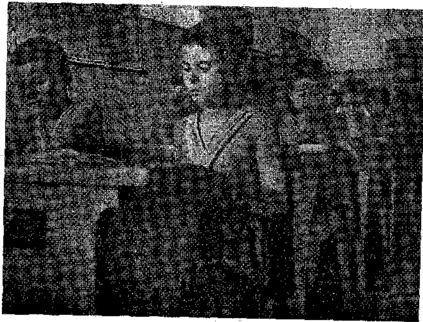
Τα λόμπουλα, σε καλοκαιρινό σχολείο κάνουν μάθημα φωνώντας μόνο τα μπαγιερά τους.