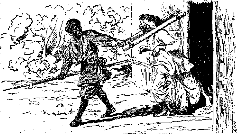
Ἐνας εἰδικὸς ἤρθε νὰ παραλάβῃ τὸν δυστυχισμένον πιστωτὴ τοῦ Ἀσπρου Λύκου (Σελ. 359, στ. β')

δίνεις ὄσες ὑποσχέσεις θέλεις. Μὴν νομίζεις ὅμως πῶς θὰ μὲ κοροιδέ- ψης. Ἐγὼ κάνω καὶ μ' ἄλλους πιδ πονηροὺς ἀπὸ σένα καὶ κανέναν ποτέ, δὲν μὲ κοροιδεψέ.