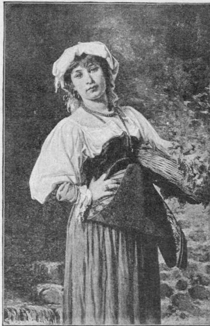
ΕΚ ΤΩΝ ΑΓΡΩΝ

ἀνθρώπινος λόγος εὐκόλως ἀπατώμενος δὲν δύναται νὰ χρησιμεύῃ ὡς κανὼν καὶ μέτρον τῆς διδασκαλίας τῆς Γραφῆς· ὅτι τοιοῦτοτρόπως καθιστῶσιν ἀβεβαίαι τὰς θρησκευτικὰς πεποιθήσεις καὶ ὀδηγοῦσιν εἰς τὴν ἀπιστίαν. Ἡ Γραφὴ ἔλεγον περιέχει τὴν ἀποκάλυψιν τοῦ Θεοῦ, ὅ,τι ἄρα διδάσκει, πρέπει ὁ ἀνθρώπινος νοῦς νὰ παραδέχεται ὡς ἀλήθειαν, καὶ ὅταν ἀκόμη ὑπερβαίῃ τὰς δικαιοηθικὰς δυνάμεις αὐτοῦ· διότι τὸ πεπερασμένον πνεῦμα δὲν δύναται νὰ περιλάβῃ τὸ ἄπειρον· οὐ μόνον δὲ ἐν τῇ θρησκείᾳ μένουσι πολλὰ ἄλυτα καὶ μυστηριώδη ζητήματα, ἀλλὰ καὶ ἐν τῇ φύσει· καὶ ἐν πάσῃ ἄλλῃ σφαίρᾳ τῆς ἀνθρωπίνης νοήσεως. Οἱ θεολόγοι οὗτοι ὡς παραδεχόμενοι τὸ ὑπερφυσικόν, τὰ ὑπερφυσικὰ δηλ. γεγονότα τῆς Γραφῆς καὶ τὰ ὑπὲρ λόγον δόγματα αὐτῆς, ἐκλήθησαν ὑπερφυσικοὶ (Supranaturalistae), ἢ δὲ ἀρχὴ των Supranaturalismus. Δὲν ἐνέμενον ὁμῶς· καὶ