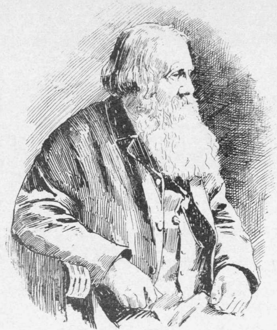
Ε. Α. ΦΡΗΜΑΝ

ριώτεραι ιδέαι των περίπου ήσαν αι εξής. Ὑπάρχει Θεός ποιήσας τὸν κόσμον καὶ προνοῶν περὶ αὐτοῦ. Οἱ ἄνθρωποι ἀποπλανηθέντες ἀφῆκαν τὴν λατρείαν τοῦ ἀληθινοῦ Θεοῦ καὶ ἐξηγρηώθησαν. Εἰς τὴν λατρείαν τοῦ ἀληθινοῦ Θεοῦ καὶ τὴν ἠθικὴν ἀναγέννησιν ὠδήγησε τὸν κόσμον ὁ Χριστός διὰ τῆς διδασκαλίας καὶ τῆς ἀρετῆς του, ἧς ἐπισφράγισις ὑπῆρξεν ὁ θάνατός του. Σώζεται ὁ ἀκολουθῶν τὸν Χριστὸν καὶ ἐμφορούμενος τοῦ πνεύματός του. Ἡ λατρεία ἀποτελεῖται ἐκ συμβολικῶν πράξεων. Ἡ ψυχὴ εἶναι ἀθάνατος. Οἱ κυριώτεροι δογματικοὶ τῆς σχολῆς ταύτης ὑπῆρξαν ὁ Ροῦρ καὶ ὁ Βερσχάιδηρ.