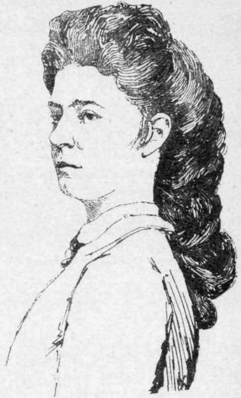
Η ΑΥΤΟΚΡΑΤΕΙΡΑ ΤΗΣ ΑΥΣΤΡΙΑΣ

— Ἐν τῇ Φιλολογικῇ Ἐταιρίᾳ τῆς Κωνσταντινουπόλεως, κατὰ τὴν συνεδρίασιν τῆς 10 Μαρτίου, ὁ καθηγητὴς Ῥόβινσον ὤμιλησε περὶ τίνος ἐλληνικοῦ κώδικος, χρονολογουμένου ἀπὸ τοῦ 16 αἰῶνος καὶ περιέχοντος 1) ἐλληνικὸν γλωσσάριον· 2) χριστιανικὰ ἔκθετα, πεποικημένα εἰς ἰαμβικούς στίχους· 3) ἐξακείρους Γρηγορίου τοῦ Νηζιανζηνῶ καὶ 4) τεμάχια ἀναφερόμενα εἰς τὴν ἐν Φλωρεντίᾳ Σύνοδον. Τὸ γλωσσάριον εἶναι κατὰ τοῦτο πολυτίμητον, ὅτι δι' αὐτοῦ δύναιται νὰ ἐπιδιωρθωθῇ πολλὰ καὶ συμπληρωθῇ τὸ λεξικὸν τοῦ Ζωναρά. Ὁ καθηγητὴς Ῥόβινσον προτίθεται νὰ δημοσιεύσῃ προσεχῶς τὸ περὶ οὗ ὁ λόγος χειρόγραφον.