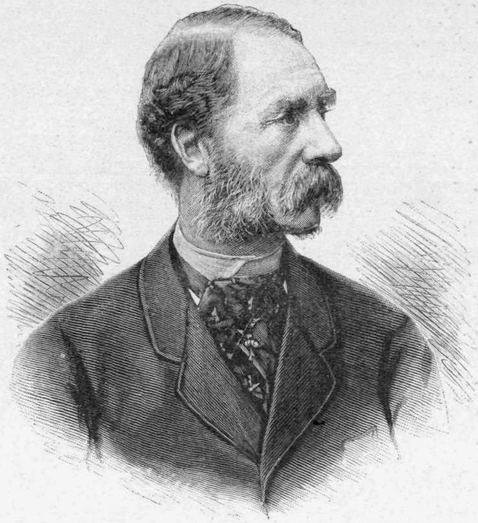
Ο ΒΑΣΙΛΕΥΣ ΤΗΣ ΔΑΝΙΑΣ ΧΡΙΣΤΙΑΝΟΣ

ἀγαθοῦ Παρρήση, ὁ περιβάλλον ποτὲ μὲ γλοερόν πλαίσιον τὴν γαληνιώσαν λίμνην, τὴν ἀντανακλώσαν εἰς τὰ νερά της τὸ αἴθριον κυανούν, οὔτε κἄν ἡ καλύβα τοῦ Λούκα τοῦ Θα-