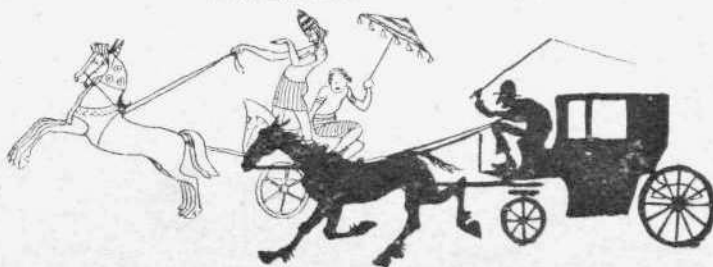
Ἐν Ἀθήναις ἐκ τοῦ Τυπογραφείου τῆς Ἑστίας. 1892—78