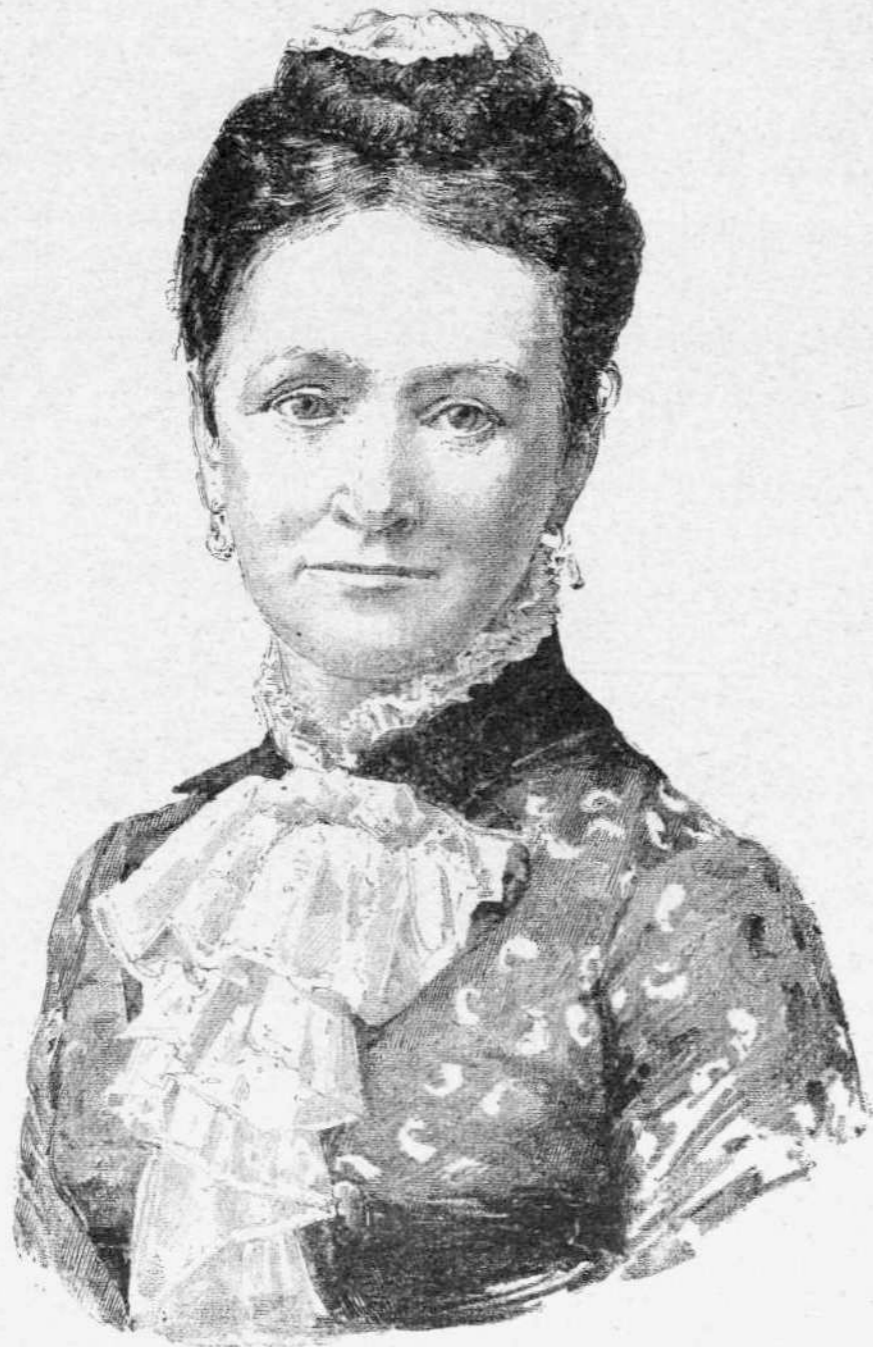
Η ΒΑΣΙΛΙΣΣΑ ΤΗΣ ΔΑΝΙΑΣ ΛΟΥΪΖΑ ἐπὶ τῆ πεντηκονταετηρίδι τῶν γάμων τῆς