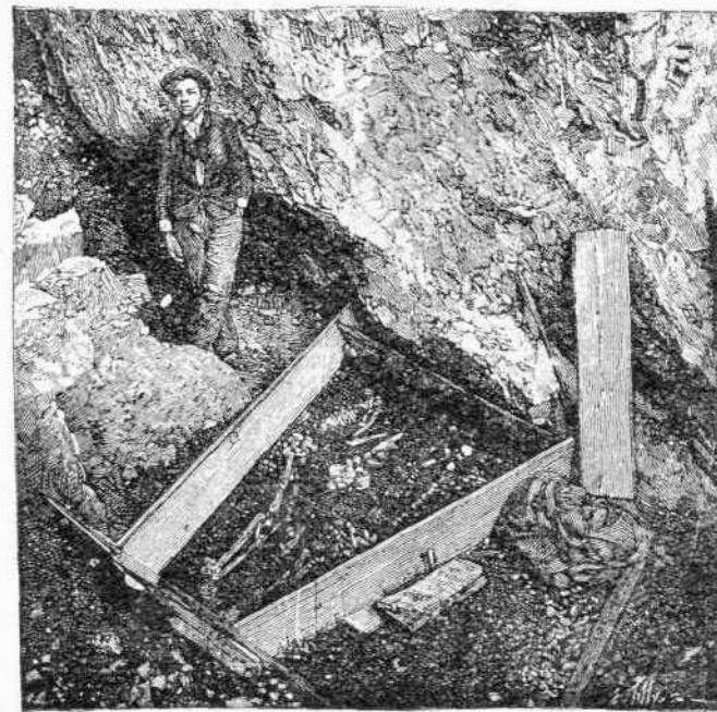
Οἱ εὑρεθέντες σκελετοὶ

Οἱ σκελετοὶ οὗτοι τρεῖς τὸν ἀριθμὸν εὑρίσκον- ται εἰς ἀπόστασιν 18 μέτρων ἀπὸ τῆς εἰσόδου τοῦ σπηλαίου ἔχοντος βάθος μέτρα 31,50 κατὰκειν- ται πλησίον ἀλλήλων καὶ ἐγκαρσίως τοῦ ἐσωτε- ρικοῦ τοῦ σπηλαίου, ἐνῶ οἱ ἀνακαλυφθέντες κατὰ τὰ 1872, 1873 καὶ 1875 ἔκειντο κατὰ τὴν