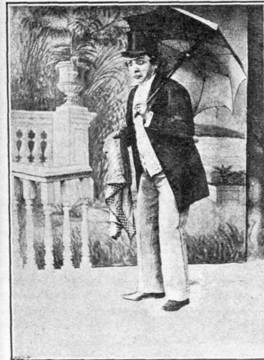
«Ὁ ἀριθμὸς 13»