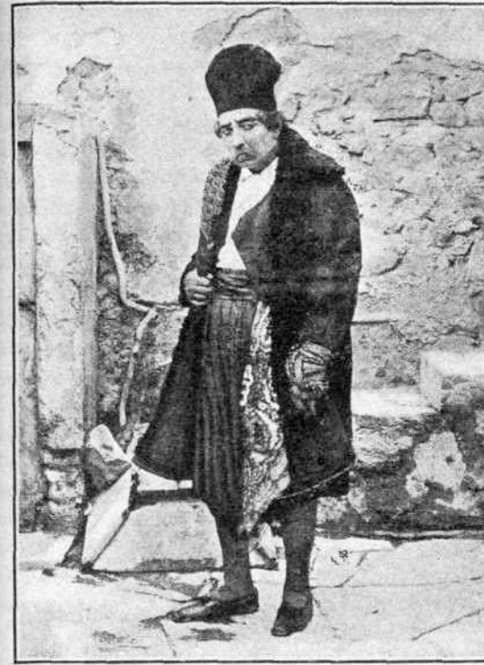
«Τύχη τῆς Μαρούλας»

Ἀλλ' ἐκτός τῆς κοινῆς ἐκτιμῆσεως, ἐκ τῶν κατωτάτων στρωμάτων εἰς τὰνώτατα ἐκτεινομένης καὶ πάλιν διατηρούσης τὴν δύναμιν τῆς, ἔχω ἀκόμη καὶ τὸ ἰδικόν μου αἶσθημα καὶ τὴν ἰδικὴν μου ἐκτίμησιν — πράγματα πρὸς τὰ ὁποῖα, τὸ ὁμολογῶ μετὰ συντριβῆς, τρέφω ἀπερίοριστον ὑπόληψιν. Πρὸ πάσης ἐραρμογῆς κανόνος αἰσθητικοῦ ἢ ἐκτιμῆσεως