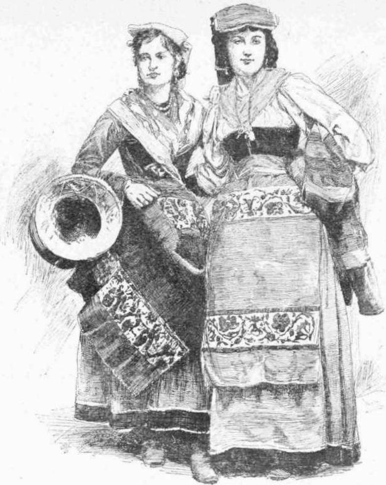
ΓΥΝΑΙΚΕΣ ΕΚ ΤΗΣ ΠΕΡΑΝ ΤΟΥ ΤΙΒΕΡΕΩΣ ΧΩΡΑΣ

Τινὲς ἐκ τῶν τάφων ἐκείνων ἔχουσιν ἀκόμη ζωγραφίας, ἃς ὁ χρόνος ἐβλάψεν οὐκ ὀλίγον. Τὰς ζωγραφίας ταύτας εἶναι ἄξιον νὰ μελετήσῃ τις ἐπιμελῶς διότι εἶναι αἱ πρῶται ἀρχαὶ τῆς χριστιανικῆς τέχνης, ἣτις βλέπομεν ὅτι ἀπὸ τῆς πρώτης ἡμέρας