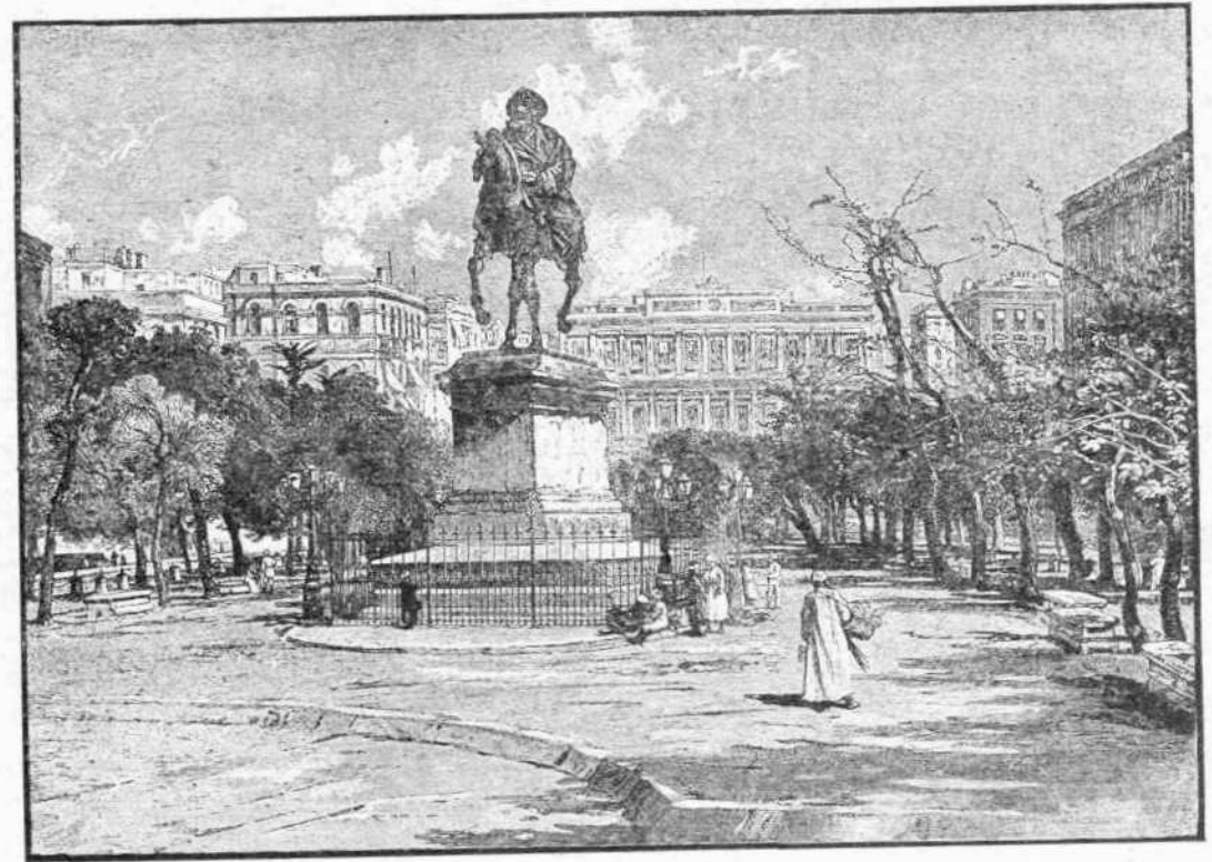
Ἡ πλατεῖα Μεχμέτ ἐν Ἀλεξανδρείᾳ

Ἡ μεταγγίσις, ὅπως γίνεται, πράγματι βλέπτει τὸν ρητινίτην. Ἐν πρώτοις οὗτος ἐκτιθέμενος εἰς τὸν ἀέρα χάνει τὸ ἀνθρακικὸν ὀξύ, τὸ ὁποῖον ἔχει μείνει ἐν αὐτῷ διαλελυμένον ἀπὸ τοῦ καιροῦ τῆς ζυμώσεως. Τὸ αἶριον τοῦτο ἔχει μεγάλην σημασίαν διὰ τὴν γεῦσιν τοῦ οἴνου, τὸν ὁποῖον κάμνει νοστιμώτερον, εἰς αὐτὸ δὲ χρεωστῆται ἡ προτίμησις, τὴν ὁποῖαν δεκνύουσιν οἱ γινώσκαι διὰ τὸ κρασί, τὸ ὁποῖον εἶναι ἀπὸ τὸ βαρέλι, ἀπέναντι ἐκείνου, τὸ ὁποῖον ἔμεινε χρόνον τινα ἐξῶ. Ἐπὶ τῆς παρα-