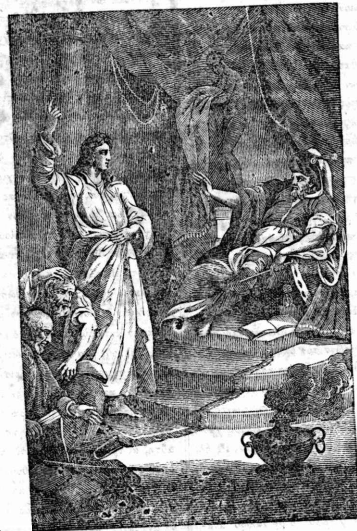
Ο ΙΩΣΗΦ ΕΞΗΓΩΝ ΤΟ ΟΝΕΙΡΟΝ ΤΟΥ ΦΑΡΑΩ.

Ἰωσήφ ὁ ἐνδέκατος υἱὸς τοῦ Πατριάρχου Ἰακώβ ἠγαπᾶτο πολὺ ὑπὸ τοῦ πατρὸς αὐτοῦ διὰ τὸν γλυκὴν χαρακτῆρα, τὰς ἀρετὰς καὶ τὰ προτερήματα αὐτοῦ. Ἄλλ' ἢ πρὸς αὐτὸν ἐξαιρετικῇ αὐτῇ πατρικῇ ἀγάπῃ ἐ-