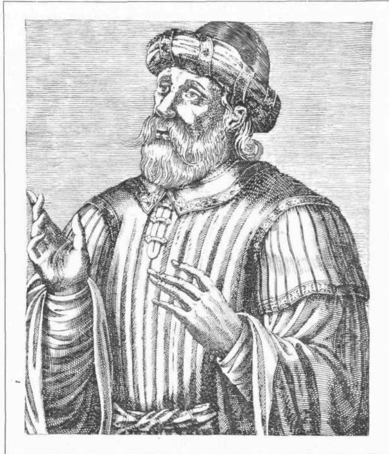
ΚΩΝΣΤΑΝΤΙΝΟΣ ΙΒ΄ ΠΑΛΑΙΟΛΟΓΟΣ ΔΡΑΓΑΣΗΣ

Ἡ ἐνταῦθα δημοσιευομένη εἰκὼν, ἣν ἐλάβομεν παρὰ τοῦ κ. Σπυρ. Π. Λάμπρου, μέλλοντος νὰ δημοσιεῖσθαι αὐτὴν ἐν τῷ προσεγγεῖ τευχεῖ τοῦ Νέου Ἑλληνομνήμονος, ἐλήφθη ἐκ τῆς ἀρχαίας καὶ σπανίας συγγραφῆς τοῦ Ἀνδρέου Thevet τῆς ἐπιγραφομένης Les vrais portraits et vies des hommes illustres grecs, latins et payens, anciens et modernes, recueillis de leurs tableaux, livres, medalles antiques et modernes καὶ ἐκδοθεῖσης ἐν Παρισίῳ τῷ 1584. Παριστάνει δὲ τὸν Κωνσταντῖνον Παλαιολόγον, ἀλλ' εἶνε φανταστικὴ, ὅπως ἄλλως εἶνε καὶ ὅλαι αἱ εἰκόνες τοῦ μάρτυρος, οὐδεμιᾶς περισωθεῖσης πιστῶς τοιαύτης.