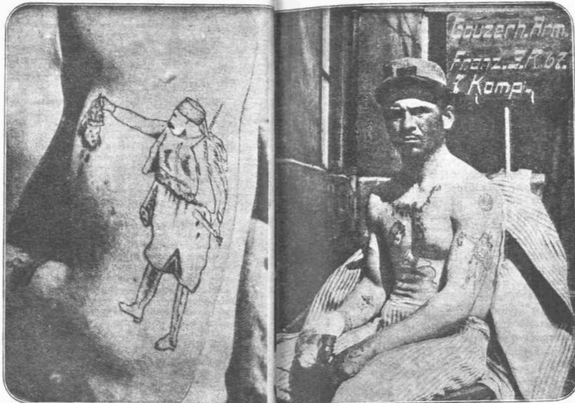
ΤΟ ΗΘΙΚΟΝ ΤΩΝ ΓΑΛΛΩΝ.—Κυντᾶξτε μὲ τί προσπάθειον οἱ Γάλλοι νά τονώσουν τὸ ἠθικὸν τῶν στρατιωτῶν τους, διὰ νά πολεμήσουν τὴν γερμανικὴν ὀργάνωσιν καὶ τὴν γερμανικὴν χαλυβδίνην δυνάμειν καὶ θέλησιν. Ὁ στρατιώτης, τὸν ὁποῖον παριστᾷ ἡ ἀνωτέρω εἰκὼν, εἶναι Γάλλος τοῦ ἴου λόγου τοῦ ἑτοῦ περικου συντάγματος τῆς 21ης καὶ νοσηλεύεται εἰς τὸ νοσοκομεῖον τοῦ Μέλκι ὑπὸ τῶν Γερμανῶν. Εἰς τὸν βραχίονά του φέρει ζωγραφισμὸν μὲ ἀνεξίτηλον μελάνι σκουρῶ, ὁ ὁποῖος κρατεῖ εἰς τὸ χεῖρ του κεφαλὴν Γερμανοῦ στρατιώτου. Μὲ τὰ μέσα αὐτὰ ὑποθέτουν οἱ Γάλλοι, ὅτι εἶναι δυνάμει νά τονώσῃ τὸ κατασυντριβὴν ἠθικὸν τοῦ στρατοῦ τους.