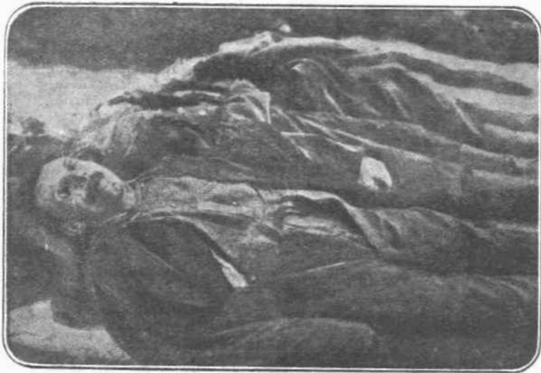
ΑΙΤΑΓΡΙΑΤΗΤΕΣ ΤΩΝ ΡΩΣΩΝ.—Οἱ Ὄννοι, οἱ Βάρβαροι, οἱ Κάφροι, οἱ Μπόξ, φωνάζουν οἱ Σύμμαχοι διὰ τοὺς Γερμανοὺς. Τώρα εἶναι καὶ ἡ σειρά τους. Καμαρωτοὶ τους καὶ αὐτοὺς Χωρικοὶ τοῦ γῆρα Μέλκι, τοὺς ὁποίους οἱ Ρώσοι στρατιῶται, εἰς τὸ πέρασμά των, συνέλαβον καὶ ἀφ' οὗ τοὺς ἐσφάζαν τοὺς ἐξώρην κατόπιν τοὺς ὀφθαλμοὺς.