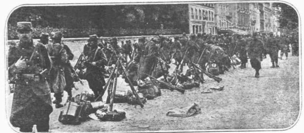
ΤΟ ΒΕΡΝΤΕΝ.—Ἡ μεγαλειτέρα προσοχὴ τῶν Γάλλων εἶναι συγκεντρωμένη αὐτὴν τὴν στιγμὴν εἰς τὸν τοῦρα τοῦ Βερντέν, ὅπου κινεῖται ἡ τύχη τῆς Γαλλίας καὶ μαζί της καὶ ἡ τύχη ὅλων τῶν Συμμάχων. Στρατεύματα δὲ εἶναι δυνατόν. Ἔστω καὶ ἐλάχιστα, ἐξοικονομοῦνται ἀπὸ ὅλα τὰ ἄλλα σημεῖα, διὰ νά μεταφερθοῦν καὶ ἐνισχύσουν τὸν ἐκεῖ μαχόμενον Γαλλικὸν στρατόν.