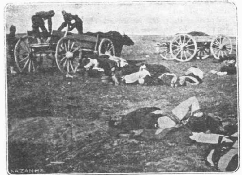
ΜΕΤΑ ΤΗΝ ΜΑΧΗΝ.—Νὰ τί ἀπομένει μετὰ τὴν μάχην. Σωροὶ ἀπὸ πτώματα ἔδω κα' ἐκεῖ σωριασμένα, ποὺ ἦσαν πρὶν ρωμαιοὶ καὶ ἰνδοουσιώδεις στρατιῶται, δομώντες πρὸς κατασύντριψιν τοῦ ἐχθροῦ καὶ πρὸς ἰπερασίαν τοῦ πατρίου ἔδαφους.