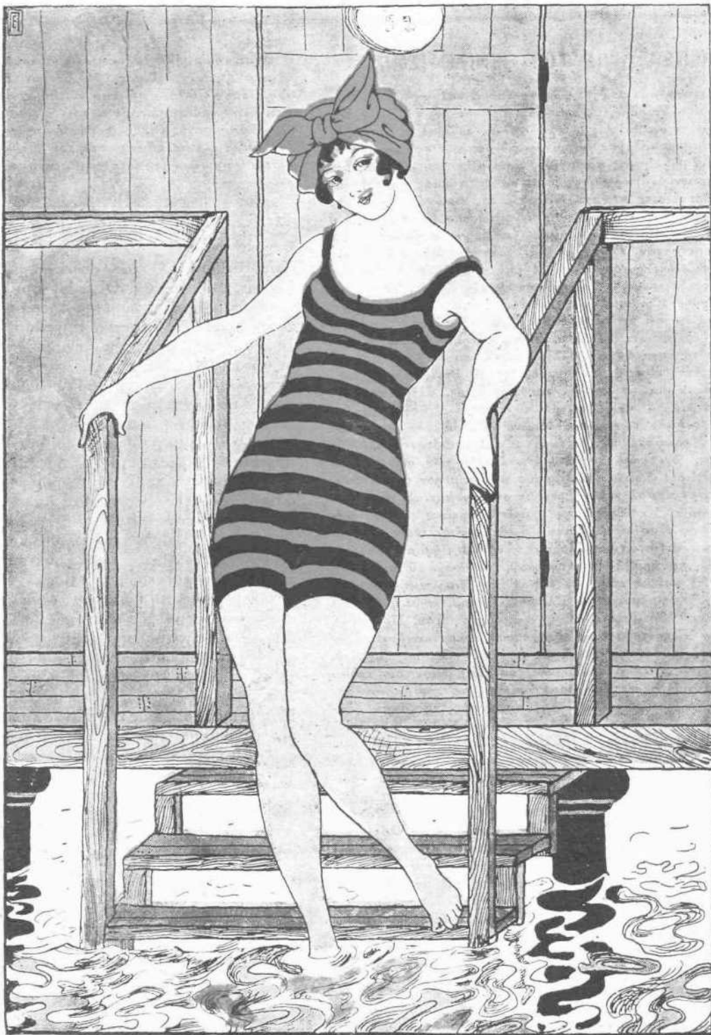
ΣΤΑ ΜΠΑΝΙΑ ΤΟΥ ΦΑΛΗΡΟΥ