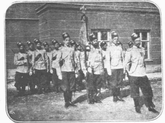
Ἡ ΑΝΑΚΤΟΡΙΚΗ ΦΡΟΥΡΑ.—Εἰς τὴν Μασσαλίαν μαζί μὲ τὰ ὀλίγα Ρωσικά στρατεύματα, μεταφέρθησαν καὶ ὀλίγοι ἀπὸ τοὺς ἐπιλεκτοὺς στρατιώτας τῆς Ἀνακτορικῆς φρουρᾶς τοῦ Αὐτοκράτορος πασῶν τῶν Ρωσῶν. Οἱ στρατιῶται οὗτοι κάμνουν ἰσχυρὰν ἐντύπωσιν εἰς τοὺς ἀγαθοὺς Μαροσιζοὺς μὲ τὴν ἰδιόρρυθμον στολὴν τους καὶ τὴν ἐξωριστὴν ἀγρίαν φροιογνυμίαν τους.