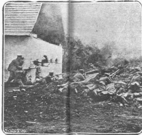
Ἡ ἸΜΕΘΟΔΟΣ.—Τίποτε δὲν κάμνουν οἱ Γερμανοὶ χωρὶς μέθοδον καὶ χωρὶς σύστημα. Ὅλα μετρημέναι καὶ διὰ ὑπολογισμῶν εἰς τὸ δευτεροβάλετο. Καὶ τὴν παραμικρομένην ἀνωμαλίαν τοῦ ἔδαφους καὶ τὸ παραμικρότερον σπιντάκι χρησιμοποιοῦν ὡς ἔρεισμα διὰ τὰς ἐναντίον τῶν Γάλλων ἐπιθέσεις ἂν εἰς τὸ Δυτικὸν μέτωπον.