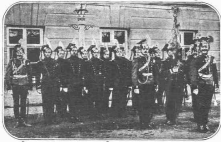
ΔΙΑ ΤΗΝ ΒΑΛΚΑΝΙΚΗΝ.—Είς τήν Μασσαλίαν ἐξοικουθούν νά γυνάζωνται καί νά προετοιμάζωνται τά εἰς τὸ Δυτικὸν μέτωπον μεταφερθέντα Ρωσικά στρατεύματα, διὰ νά μεταφερθοῦν εἰς τὴν Θεσσαλονίκην. Οἱ Σύμμαχοι σέπτονται, μετὰ τὴν συμπλήρωσιν τῆς μεταφορᾶς τῶν Ρώσων εἰς τὸ Βαλκανικὸν μέτωπον, νά ἐνεργήσουν ἐπίθεσιν κατὰ τῶν Αὐστρογερμανῶν καί νά τοὺς ἐκτοπίσουν ἐκ τῶν Ἑλληνοβουλγαρικῶν συνόρων, διὰ νά κατορθώσουν νά φέρουν ἀντιπερισσασμὸν εἰς τοὺς Γερμανοὺς εἰς τὸ Δυτικὸν μέτωπον.