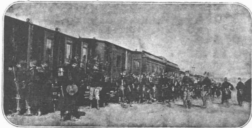
Ἡ ΠΡΟΕΤΟΙΜΑΖΟΜΕΝΗ ΕΠΙΘΕΣΙΣ.—Διαρκῶς προετοιμάζουσι ἐπίθεσιν οἱ Σύμμαχοι εἰς τὴν Θεσσαλονίκην καὶ διαρκῶς ἀναβάλλεται. Οἱ σιδηροδρομοὶ Μοναστηρίου καὶ Σκοπεῖων καθήμερον εὐρίσκονται εἰς διαρκὴ καὶ ἀέννησον κίνησιν, μεταφέροντες στρατεύματα ἀπὸ τοῦ ἑνὸς ἄκρου εἰς τὸ ἄλλο τῆς Ἑλληνικῆς Μακεδονίας καὶ τανάπαυλιν. Καὶ διαρκῶς ἡ ἐπίθεσις ἀναβάλλεται, διὰ νά γίνων αἱ κατάλληλοι προετοιμασίαι.