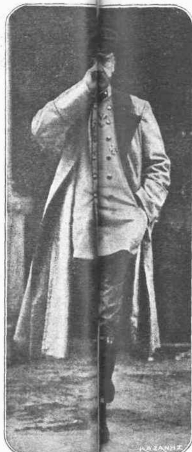
Ὁ ξινδεμπόιγκ. — Ὁ κομῆς στρατηγός, ὅπως τὸν ὀνομάζουν, λόγῳ τῆς ἐξαιρετικῆς αἰσθητικῆς καὶ ἀναπτύξεως ἥτις τὸν παρουσιάζει γιὰ τὸν ἀκούσιν εἰς τὰ προστάγματα τοῦ ἀνάτορος του, τρέχει ἀπὸ τὸ ἕνα μέτωπον εἰς τὸ ἄλλο, νὰ παραστή τὴν γνάμην καὶ τὰ φάτα του, ἀποκτείνονται ἀνάγκη.