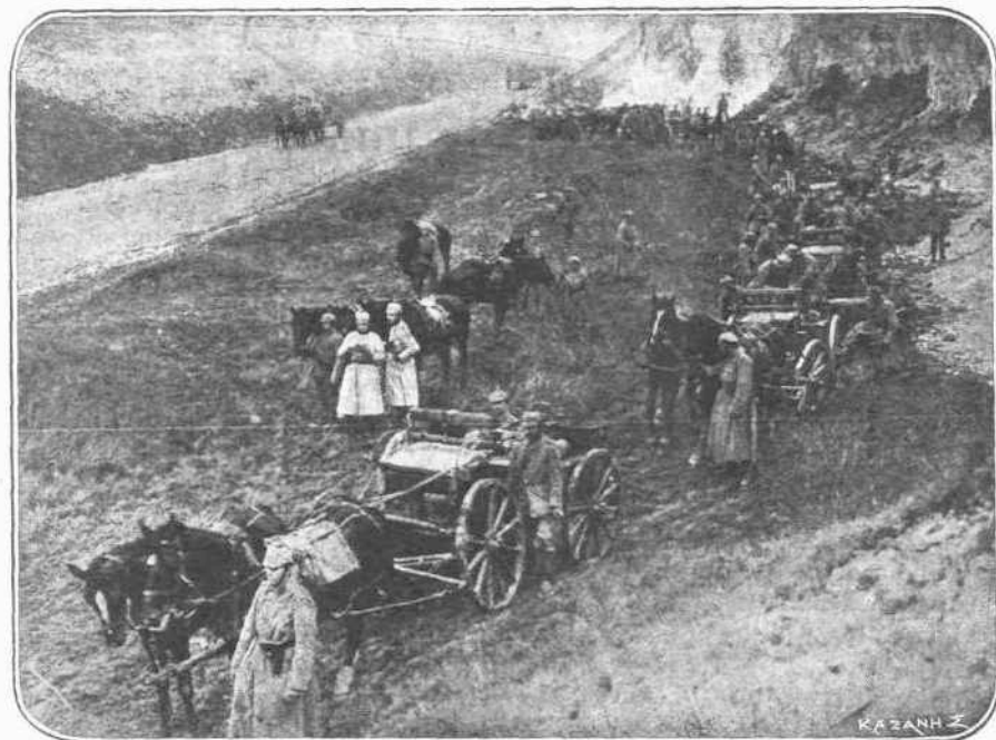
ΟΙ ΑΥΣΤΡΙΑΚΟΙ ΕΝΙΣΧΥΟΝΤΑΙ. — Καθ' ἡμέραν καὶ νέα ἐνισχύσεις στέλλονται εἰς τοὺς Αὐστριακοὺς τοῦ Ἀνατολικοῦ μετώπου, πρὸς ἀντιμέτωπιν τῆς Ρωσικῆς ἐπιθέσεως, ἥτις κατ' ἀρχὴν ἀνεχαιτίσθη. Μακρὰ σειρὰ πυροβολικῶν διασχίζουν τὰς Οὐγγρικὰς πεδιάδας, ὀδεύουσαι πρὸς τὸ μέτωπον τῆς Αὐστριακῆς παρατάξεως, ὅπως ἐνισχύσουν τοὺς Αὐστριακοὺς εἰς τὸν κατὰ τῶν Ρώσων ἀγῶνά των. Καὶ τὸ πυροβολικὸν αὐτὸ τῶν Γερμανῶν, τὸ ὁποῖον ἐπιφέρει τόσην θραύσιν εἰς τὰς τάξεις τοῦ συμμαχικοῦ στρατοῦ, ἀνέκοψε πᾶσαν τὴν ἐπιθετικὴν ἐνέργειαν τῶν Ρώσων.