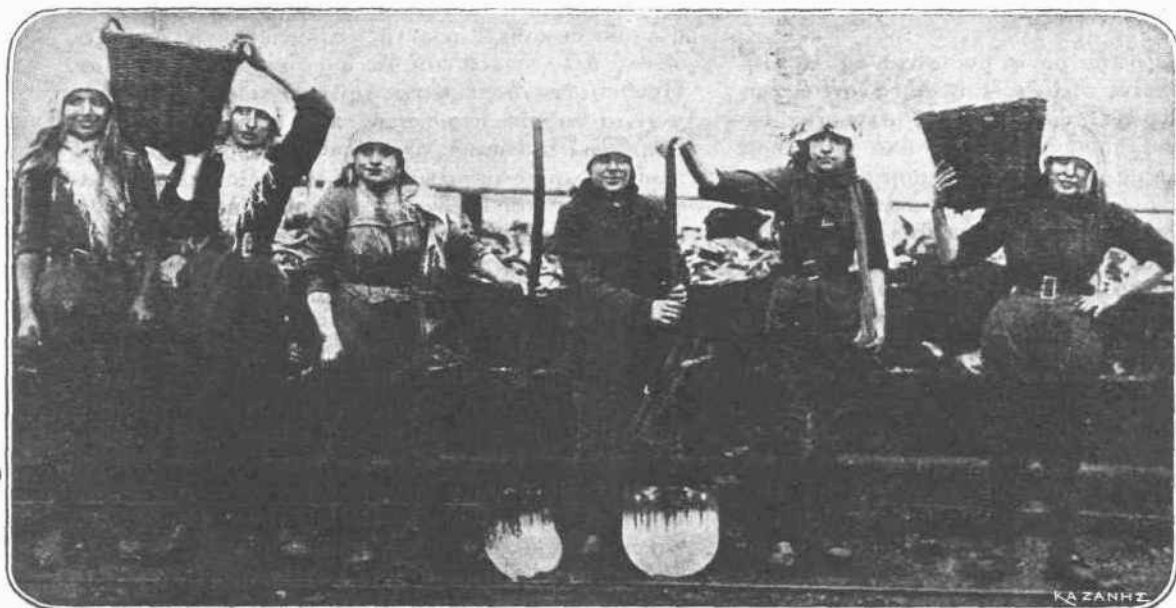
Ἡ Γερμανία. — Ἡ ἑλλειψίς τῶν ἀνδρῶν εἰς τὴν Γερμανίαν δὲν ἔφερε καμίαν ἀπολύτως μεταβολὴν εἰς τὴν κανονικὴν ζωὴν, λόγῳ τοῦ ὅτι ἀπεσῶρθησαν ἀπὸ αὐτὴν αἱ ἐργατικαὶ χεῖρες. Εἰς τὴν Γερμανίαν ἡ γυναῖκα εἶναι ὁργανωμένη ὅπως καὶ ὁ ἀνδρῶς. Ἡ κάθε κυρία καὶ ἡ κάθε δεσποινὶς ἔχει ἐν ἐπιστρατεύσει εἰς ποῖον νοσοκομεῖον πρέπει νὰ τρέξῃ καὶ νὰ ἀναλάβῃ ὑπηρεσίαν. Ἄλλη τάξις ἔχει ἀναλάβῃ κάθε εἶδος ἀνδρικῆς ἐργασίας. Καὶ ἡ λειτουργία τῆς κοινωνικῆς ζωῆς, χάρις εἰς τὴν θαυμασίαν ὁργανώσιν, τὴν ὁποῖαν ἔχει εἰσαγάγει τὸ Γερμανικὸν πνεῦμα, προχωρεῖ μὲ τὸν ἴδιον ρυθμὸν, ὅπως καὶ κατὰ τὴν ἐποχὴν τῆς εἰρήνης.