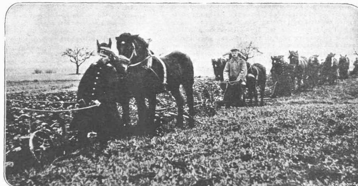
Τὸ γερμανικὸν πνεῦμα. — Ἄλλος ἕνας θρίαμβος τῆς πρακτικότητος τοῦ Γερμανικοῦ πνεύματος. Θαυμάσατε μέχρι ποίου σημείου ἔχει φθάσει ἡ προνοητικότης καὶ ἡ προβλεπτικότης του. Πίσω ἀπὸ τὴν πρώτην γραμμὴν τοῦ πυρός καὶ μακριὰ ἀπὸ τὸν ἦχον καὶ τὴν βολὴν τοῦ τηλεβόλου, ὁ γερμανὸς στρατιώτης, ποῦ ἦτο πρώτα γεωργός, ἀγώνει, μὲ τὸ ἀρσενικὸν ποῦ τοῦ ἔδωσαν ἡ Κυβέρνησις του, τὴν ξένην γῆν, διὰ νὰ σπεύρῃ καρπὸν, ὁ ὁποῖος θὰ τοῦ χρησιμεύσῃ κατόπιν διὰ τὴν ἐντιμήσειν του. Καὶ ἐπειτα ἀπὸ τὴν προβλεπτικότητά αὐτὴν, οἱ Σύμμαχοι περιμένουν νὰ πεινάσουν οἱ Γερμανοί!