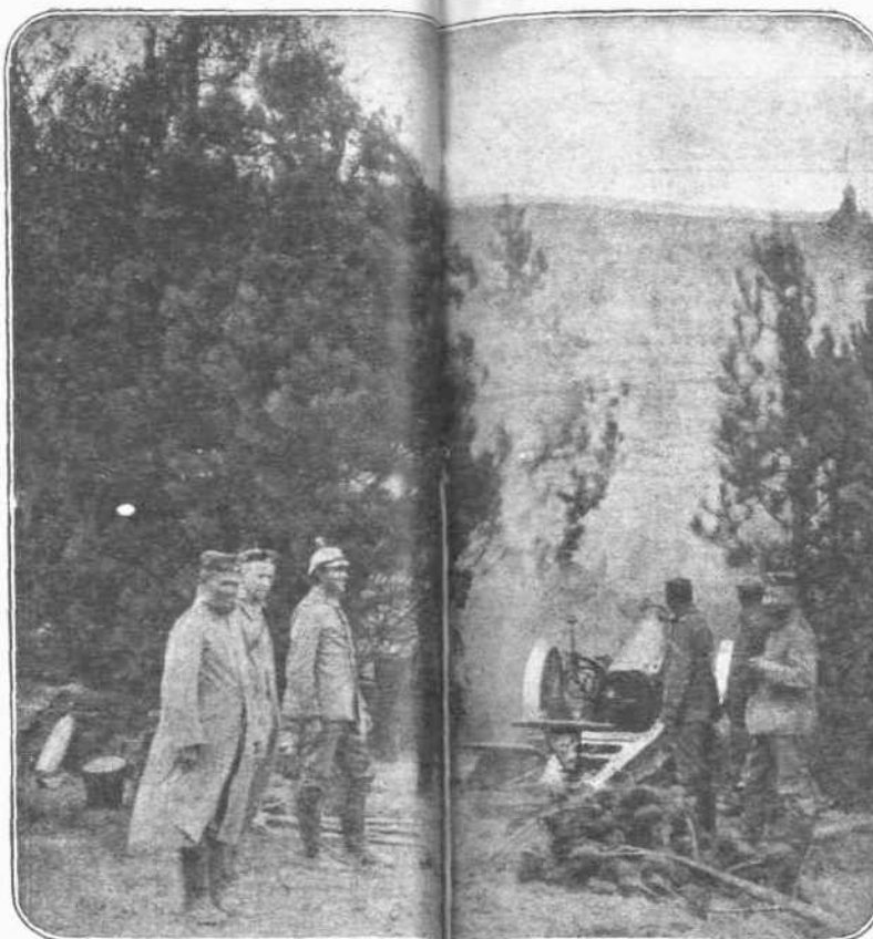
Αἱ ἐπιχειρήσεις εἰς τὸ Βερντέν. — Ἡ ἔκθεσις, τὴν ὁποῖαν ἐπιφέρει εἰς τὰς τάξεις τοῦ Γαλλικοῦ στρατοῦ τὸ θαυμασίον πυροβολικὸν τῶν Γερμανῶν, ὁμολογεῖται καὶ ὑπ' αὐτῶν τῶν ἀντιπάλων των. Κρυμμένοι μέσα εἰς τὰ δέντρα οἱ Γερμανοὶ πυροβολοῦνται καὶ ἀγρωμένοι πίσω ἀπὸ ἕνα φυσικὸν ὄχυρῶμα, ποῦ ἀποκτείνονται ἀνωμαλία τοῦ ἐδάφους, βάλλουν ἐπίστοχος κατὰ τῶν Γαλλικῶν παρατάξεων καὶ αἰετῶν τῶν σκεπτόντων τὸ πῦρ καὶ τὸν θάνατον.