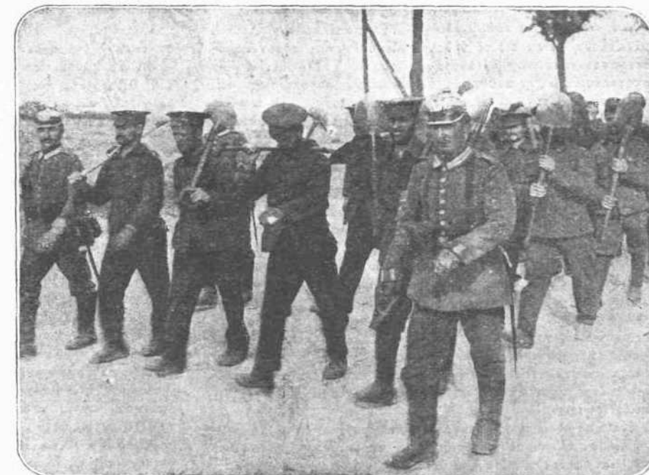
Οἱ ἀγγλοὶ αἰχμαλώτοι. — Καὶ ἄλλη μιὰ ὄψις τῆς πρακτικότητος τοῦ γερμανικοῦ πνεύματος. Τοὺς αἰχμαλώτους των οἱ Γερμανοὶ δὲν τοὺς ἀφίρουν μέσα εἰς τὰ περιορισμένα στρατόπεδα νὰ ἀνιούσιν καθ' ὅλον τὸ διάστημα τῆς ἡμέρας καὶ τῆς νυκτός. Νὰ οἱ ἄγγλοι αἰχμαλώτοι, ποῦ ὀδηγοῦνται ἀπὸ Γερμανοὺς στρατιώτας εἰς τὴν κατασκευὴν δρόμων. Ἐχουν ὅλην τὴν ἐλευθερίαν των, ἐργάζονται, ὅπως θὰ εἰργάζοντο εἰς τὴν πατρίδα τους καὶ ἀμείβονται διὰ τὴν ἐργασίαν τους αὐτὴν. Μὲ τὴν ἰδιαίτην φροντίδα δὲν ἔμπορῶν νὰ ἐπιστρέψουν εἰς τὰ μέρη των καὶ νὰ κινηθῶσιν κατὰ βούλησιν.