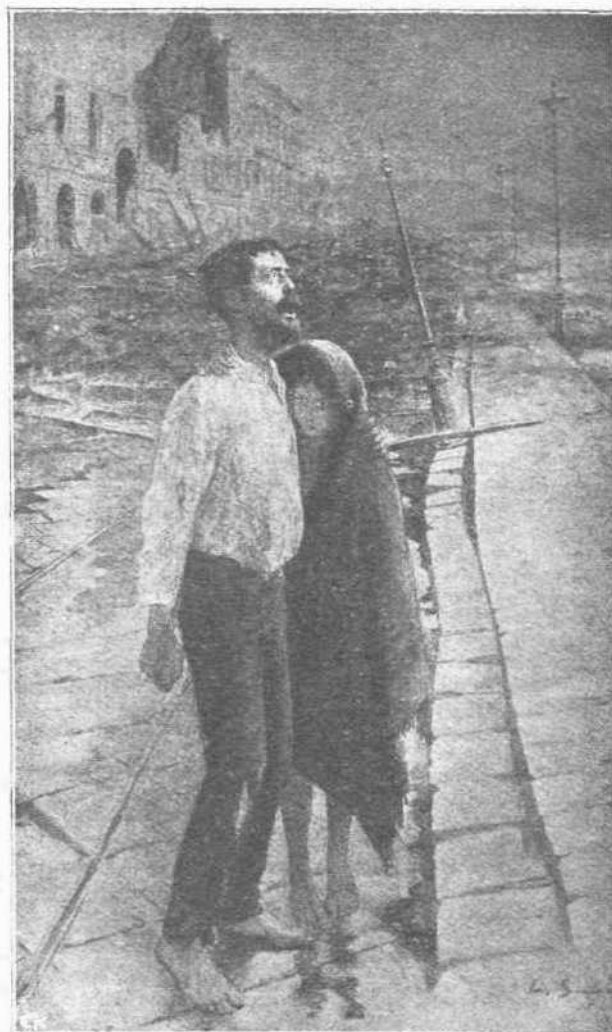
ΑΙ ΚΑΤΑΣΤΡΟΦΑΙ ΤΩΝ ΖΕΠΠΕΛΙΝ. —'Ανυπολόγιστοι εἶναι αἱ ζημίαι, αἱ προξενηθεῖσαι εἰς τὴν Ρουμανικὴν κρατερούσαν ἀπὸ τὴν ἐπίθεσιν ἐναντίον τῆς γερμανικῶν Ζεππελιν. Ὅλοκληροὶ συνοικιαὶ μετεβλήθησαν εἰς ἀγνίστῳτα ἐρείπια, ὅπως τὰ παραστανόμενα ἀπὸ τῆς ἀνωτέρω εἰκόνας, καὶ ὁλόκληροι οἰκογένεαι, συνηθισμέναι εἰς τὴν εὐμάρειαν, γυρίζουν εἰς τοὺς δρόμους μετὰ τὸ ρόδα, μετὰ τὰ ὁποῖα εὐρέθησαν τὴν τραγικὴν στιγμήν.