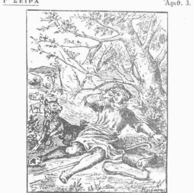
Πού είναι ή βοσκοπούλα;

ΠΡΟΣΟΧΗ Η τιμή έκάστου φύλλου, διά τους τυχόν θέλοντας, να συμπληρώσουν την σειράν της έβδομαδιαίας 'Εικονογραφημένης' και ζητούντας μεμονωμένα, ώρισθη εις λεπτά είκοσι (20). Διά τους έν επαρχίας άποστέλλονται έλεύθερα ταχυδρομ. τελών. Σειρά από 1-10 δρ. 1.50 και 11-20 δρ. 1.50.