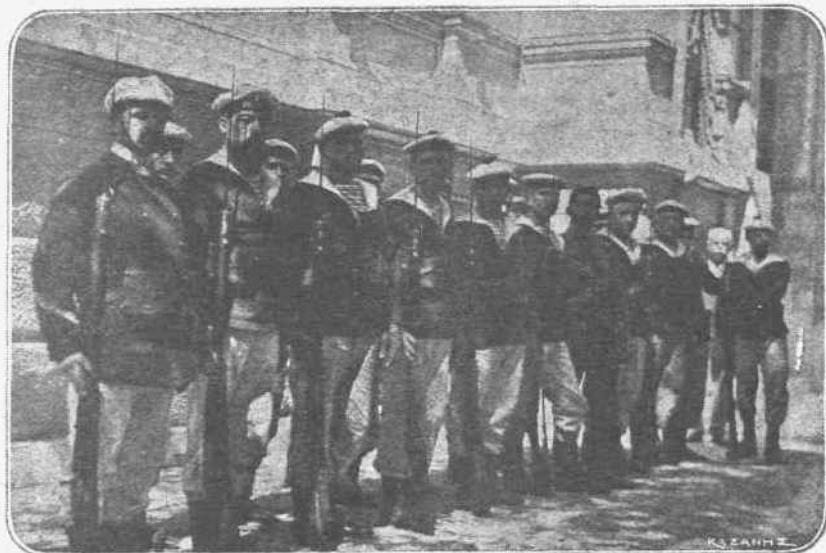
ΜΕΤΑ ΤΗΝ ΑΠΟΠΕΙΡΑΝ. —Εἶναι γνωστὴ ἡ ἀπόπειρα τῶν Βενιζελικῶν ἐναντίον τῆς Γαλλικῆς πρεσβείας, μετὰ τὸν εἰδεχθῆ σκοπὸν νὰ προκαλέσουν ἐπέμβασιν τῶν ξένων, ἀδιαφοροῦντες ἀν συσσωρευθῶσιν κινδύνους ἐναντίον τῆς πατρίδος. Μετὰ τὴν ἀπόπειραν ταύτην ἀπεβίβασθη ἀμέσως ἄγημα ἐκ τοῦ Γαλλικοῦ πολεμικοῦ «Μαρουτῆ» τὸ ὁποῖον ἐξακολουθεῖ φρουροῦν τὸ πρεσβευτικὸν μέγαρον.