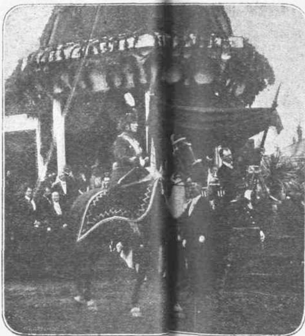
Η ΑΜΑΖΩΝ. —'Ολίγον πρὸ τῆς ἐκείνου πολέμου τῆς Ρουμανίας εἰς μίαν δημοσίαν ἐορτήν, ἡ β. Μαρία, ἡ ὁποία σὺν τοῖς ἄλλοις εἶναι καὶ δευτέρα βασίλισσα κατὰ τὴν ἑθιμολογικὴν ἀξίαν, μεγαλοπρεπῶς εἰς τὸ θέαμα τῆς, τελεία ἀμαζῶν ἐπὶ τοῦ θυμωμένου τῆς.