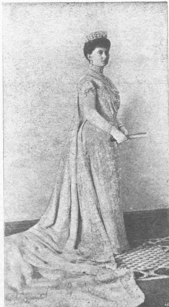
Η ΜΗΤΗΡ ΒΑΣΙΛΙΣΣΑ. —'Ασκνος και δούρατος ή Βασίλισσα, μέσα εις τόν ισάλλον και την τρικυμίαν, ποδιδέχνει την πατρίδα μας, εβρίσκει ιδίως διά την συνέχισιν της αγαθοεργού της ενεργείας. Προχθές ακόμη, κατέβηκε εις τόν Πειραιά, διά να επίθεσθαι τό Ζάννειον νοσοκομειον. Πρὸ ὀλίγων ἡμερῶν συνέπηξε νέον πατριωτικὸν σύνδεσμον τῶν Ἑλληνίδων, με σκοπὸν ἀγαθοεργόν. Καὶ διαρκῶς μεριμνᾷ καὶ φροντίζει διὰ τὴν πρόοδον καὶ τὴν ἀνάπτυξιν ὄλων τῶν σωματείων, τῶν ὁποίων εἶναι ἡ ἰδρύτρια καὶ ὁ κινήτριος μοχλός.