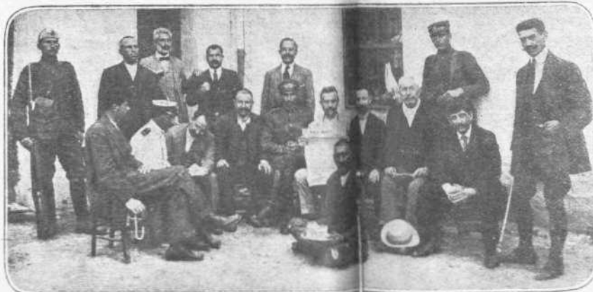
ΟΙ ΑΙΧΜΑΛΩΤΟΙ. — Ίδου τά μέσα, με τά όποια προσκομίζονται οι αιχμαλωτοί της Θεσσαλονίκης και της Μακεδονίας, άρραβωμένοι, ως οι χειρότεροι κακοτύχοι, διότι έπληθύνθησαν να προσγεθήσων εις τό αντί-δυναστικόν κίνημα των. Μεταξύ των αυτών διακρίνεται ή αρχικελευστής του Βασιλικού Α. Αντωναίου.