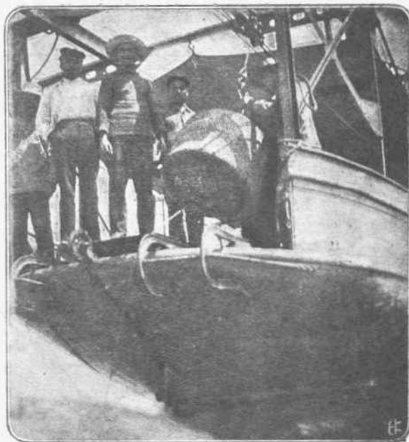
ΠΩΣ ΤΟΠΟΘΕΤΟΥΝΤΑΙ ΑΙ ΝΑΡΚΑΙ. — Δέν είναι άσκοπον, μετά τά δύο θαλάσσια δυστυχήματα, τά πλήσαντα την Έλληνικήν κοινωσίαν πρό-όλιγων ημερών, να παραθέσωμεν εικόνα του συστήματος, με το όποιον τοποθετούνται αι νάρκαι. Η εικόνα μας παρουσιάζει την πρόμηνη τορπιλοθήκη, ή όποία είναι διασκευασμένη κατά τοιαύτον τρόπον, ώστε να σύρεται ή νάρκη επί τροχών μέχρι της άκρας της πρόμηνης και κατόπιν να καταβιβάζεται εις την θάλασσαν τῇ μεσολαβήσῃ ειδικού βαρούλκων. Η αὐτή άργασία γίνεται και διά την άνέλκυσιν.