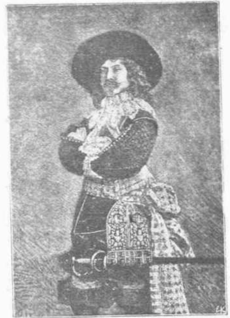
Ο ΚΑΪΣΕΡ. — Και μια εικόνα του Καίσερος άπανία, ληφθεΐσα κατά την εποχήν των νεανικών του ετών. Η φωτογραφία τών παριστάνει με την στολήν του Μεγάλου Έκλεκτορος.