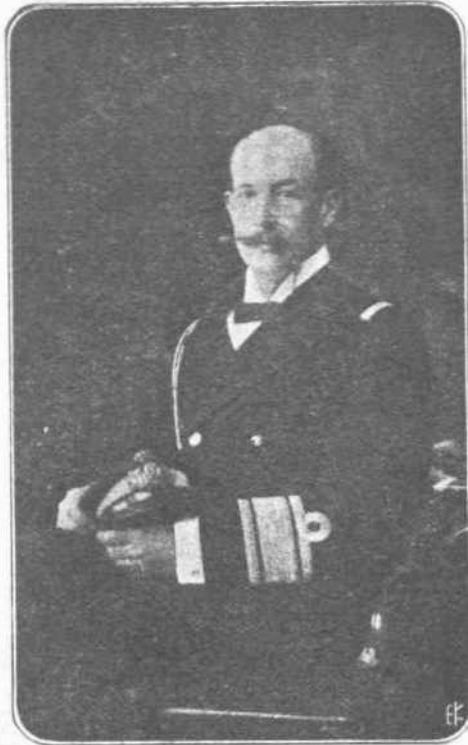
Ο ΠΡΙΓΚΗΨ ΓΕΩΡΓΙΟΣ. — Μαζί με τους Ύψηλους αδελφούς του και ο πρίγκηψ Γεωργίος, εβρισκόμενος από πολλούς εις Παρισίους, έσπευσε να επισκεφθή εις το Λονδίον την Αγγλικήν Αδύην και την Αγγλικήν Κυβέρνησιν και να εκθέσιν την αίτησιν της πολιτικής του Έστερμάνου αδελφού του, διαστρεβλωθείσαν από τους ένδιωφρομένους κύκλους. Ο πρίγκηψ Γεωργίος άναμνεται να έλθη ένταύθα, όπως έκδήσῃ εις τον Βασίλεα τα άποτελέσματα των ενεργειών του.