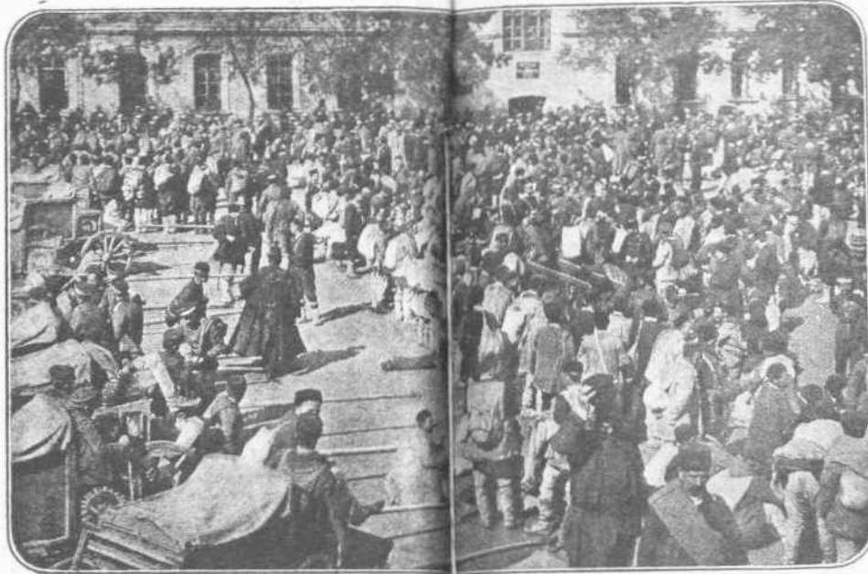
Ο ΕΚΠΑΤΡΙΣΜΟΣ ΤΩΝ ΡΟΥΜΑΝΩΝ. — Μετά τους Βέλγους, τους Σέρβους και τους Πολωνούς, ήλθε και ή σειρά των Ρουμάνων τώρα. Όλοι αι παραμεθόρια βλαχικά πόλεις και τά χωρία έξεκένωθησαν, του πληθυσμού των φεύγοντος την έχθρικήν εισβολήν εις τα εσωτερικά της Ρουμανίας. Είναι και αυτό ένα άποτέλεσμα της άστυρίας, παρασυρθείς να πολεμήσῃ.