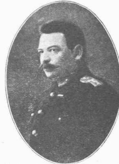
Ο ΣΤΡΑΤΗΓΟΣ ΔΟΥΣΜΑΝΗΣ. — Ποιός άγνωσι την δράσιν του και ποιός δεν ξέρει ότι ύπήρξεν ένας από τους κυριώτερους πρωτεργάτας της άναστηλώσεως της έθνικης μας ύποστάσεως, ό διευθύνων επί τούτων χρονικόν διάστημα τό Έπιτελείον; Θα ήτο παράλειψις εάν μεταξυ των άλλων δρασάντων ύπέρ του γοήτρου της πατρίδος δεν άνεφέρετο και αυτός.