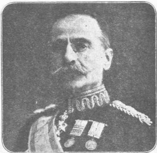
Ο ΣΤΡΑΤΗΓΟΣ ΚΑΛΛΑΡΗΣ. — Και αυτός από τους πρωτεργάτας της προχθεσινής άποκαταστάσεως της κρατικής μας ύποστάσεως. Στρατιώτης γενναίος, άλλα και διοικητικόν στρατιωτικόν πνεύμα από τα πλέον έξέχοντα.