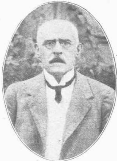
Ο ΠΡΟΕΔΡΟΣ ΤΩΝ ΔΑΣΚΑΛΩΝ. — Έτσι τον αποκαλούσαν οι προδότες, οι μη σεβόμενοι ούτε ιερών ούτε δαιον, προκειμένου να συκοφαντήσουν και να καταστρέψουν την πατρίδα τους. Άλλ' ό άρχηγός των δασκάλων άπεδείχθη πολιτικώτερος και από τους πλέον έμπειρους πολιτικούς των, και ό γεγονός και σεβάσμιος καθηγητής άνεδείχθη δεξιός κυβερνήτης και εύστοχος διπλωμάτης εις τας βεινάς αυτές περιστάσεις.