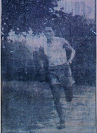
Ό χθεσινός πανέδοξος θριαμβευτής του ιστορικού Μαραθωνείου Στέλλιος Κυριακίδης σε μία παλαιά του προπόησι

σαν θριαμβευτικά, τόσο θριαμβευ- τικά μάλαστα που οι αντίπαλοι πλημμύρισαν στα προπόλια του μισοτέρου ένδοξουάδως φιλοάσαν Οί ύπουργοί, ό Μητροπολίτης, οι τούς, ύπεκρεώθησαν ν' άναγνωρι- σταθίου και στην στροφή της Λεω- τοξίας έπιλάνας των. Με τό δίπλο προσέλαται των Βαλκανικών Κρα- τούς. Τό έπιστάγιομα του εθνικού θριάμβου ήταν ή νίκη μας στο Μα- ραθώνιο.