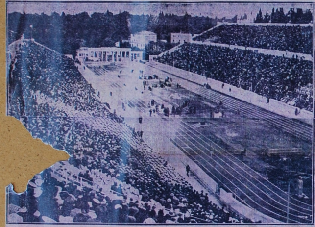
Μοκωμένη ανθρωποθάλασσα οι φιλαθλοι πλημμύρισαν το Στά- διο και άποθέωσαν τους Βαλκαν- κούς άσους στη μεγαλειώδη προσπάθεια της επικρατησίας των

Η χθεσινή εξαιρετική λακάδα. Από το μεσημέρι οι περισσότεροί άσους την συγκέντρωσι του κό- η οποία από το μεσημέρι άρ- ται μπουλούκια μπουλούκια οι φ-