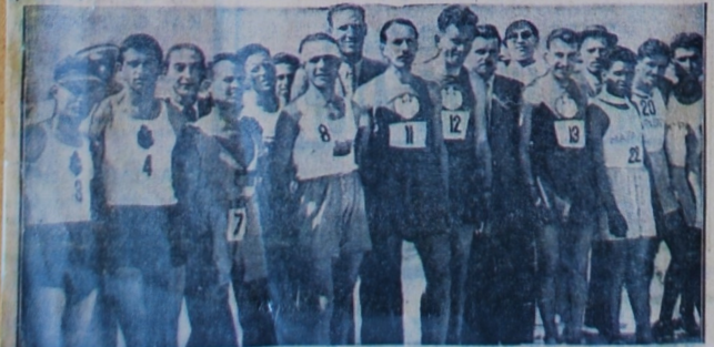
Οί Έται Μαραθωνόδρομοι που μετέσχον χθες στη μεγαλιώδη κούρσα του Μαραθωνείου, και που ακολούθησαν για ν' άντιπάρουν έστω κι από μακριά τό θρυλικό Κυριακίδη

και συγκινημένο άκόμα από την Ι- και άκούστηκε να πείξη τό βασιλικό έλεγκτο του, σπάθηκε σε σκάσι προ- έμβεστηριο. Και σ' ένα λεπτό ή Α. σούης όταν οι Έθνικοί όμνοι των Α. ό Βασιλικός Έκαμη την έμφάνσι Βαλκανικών Κρατών συνόδεισαν του στα προπόλιας ένα τό Στάδιον ύποστολήν των σημαϊών, και οιείστανε από έπειρημίες και χει- θριακοροπήσινε τέλος άργά τό ροκροτήματα, γενόμενος δεκτος έράβω έσφολογώντες τους δη- από τό Υπουργικό Συμβούλιο και μιοργούς του νέου Έθνικού θρι- (Συνέχεια εις την σην αελίδα)