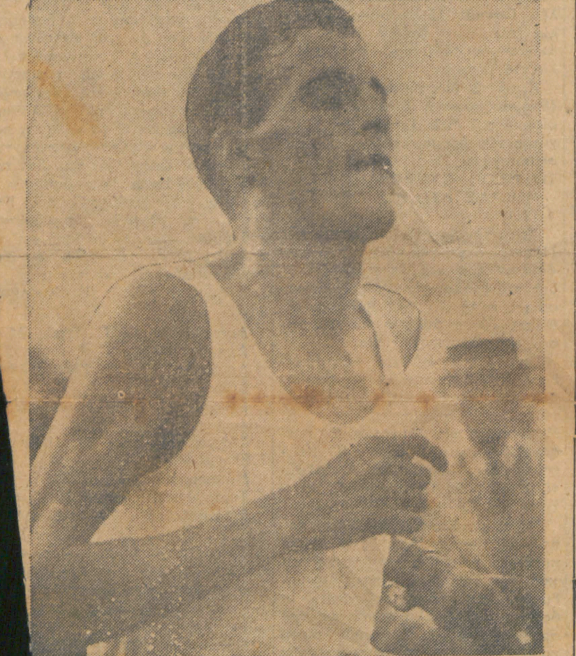
Ο θριαμβευτής της χθεσινής ημέρας των προβαλμανικων αγώνων Στέλιος Κυριακίδης που στη μεγαλειώδη χθεσινή του κούρσα δημιούργησε δύο νέα Έλληνικά ρεκόρ.

Έκεινο όμως που είνε περισσότερο ευχάριστο είνε η παρατηρηθείσα ομαδι-προβαλμανικόν.