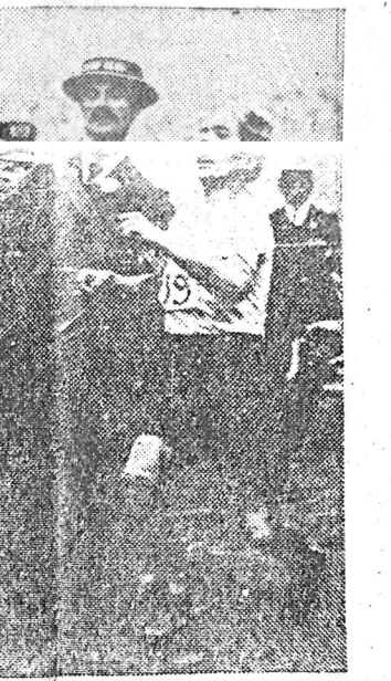
Στὸν ἀγῶνα τοῦ Λονδίνου τοῦ 1908, ὁ Ἰταλὸς Πιέτρο Ντοράντο φθάνει πρῶτος ἀλλὰ ἀκυροῦται ἡ νίκη του, γιὰτὶ τὴν τελευταία στιγμήν, εἰσαγόμενος στὸ Στάδιον, ἐξαλλίσθη καὶ ἀκολούθησε λαὸν θεαματικῶς κατεύθυνσιν, ποὺ δὲν ἔφερε πρὸς τὸ τέρμα.

2) Λομαίν (Ἐσθονία) 2:34:40, 3) Βαλέριο (Ἰταλός) 2:36:32. 8. Καὶ τὸ 1924 στὸ Παρίσι Φινλανδοῦς ἦταν ὁ Ὀλυμπιονίκης ὁ Στενρόους σὲ 2:41:22. 6, 2) Μπερτινι (Ἰταλός) 2:48:14. 6, 3) Νιτέ Μάρ (Ἀμερικῆ) 2:48:14. Τὸ 1928 στὸ Ἀμστερνταν ὁ Γάλλος "Ἐλ Ουάφι" ἐπὶ τῆ Β' Ἀφρικῆ κέρδισε τὸν Μαραθώνιο σὲ 2:32:57. 2) Πλάτσα (Χιλῆ) 2:33:23, 3) Μαρτελίν (Φινλανδοῦς) 2:35:02. Στὸ Λόνδρον τῆς 1932 νικητὴς ἦταν ὁ Ἀργεντινὸς Ζαμπάλα σὲ 2:31:36 ποὺ ἦταν νῆο ρεκόρ. 2) Φέρρις (Ἀγγλος) 2:30:55, 3) Τορβόνεν (Φινλανδοῦς) 2:32:12 σὲ τέλος στὸ Βερολῖνον τὸ 1936 ὁ Γαλλοῦς Κιτεῦ Σὸν καὶ Λιτέρευε τὴν ἐπίδοσι σὲ 2:29:19. 4) Χάρπερ (Ἀγγλος) 2:31:23, 3) Νάν (Ἰάπων) 2:31:42.