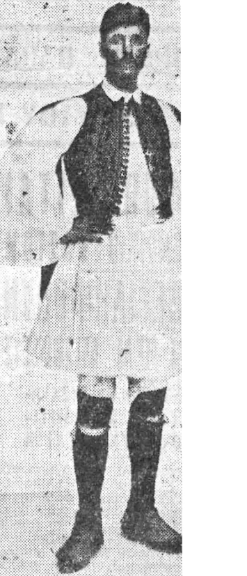
Ὁ θρυλικὸς Σπύρος Λοβανίου τοῦ πρώτου Μαραθωνίου τῶν νεωτέρων γράει εἰς τοὺς ἀγῶνας τοῦ 1891 Ἀθῆνας.

Στὸ δῶρος τῆς Βουλῆς τῶν 1900 ἔγινε ὁ Β' Ὀλυμπιακὸς Μαραθώνιος ποὺ τὸν ἐκέρῃσε ὁ Γάλλος Τε. σὺ εἰς 2 ὡρὰς 59' καὶ 45". 2) Σαμπιὸν (Γάλλος) 3:04:25, 3) Φάστ (Σουηδὸς) 3:37. Στὸν Ἅγιο Λουδοβίκον τὸ 1903 νικητὴς ἦσαν τρεῖς Ἀμερικανοί: Λίκς 3:28:53, Κέρνυ 3:43:53, Νιούτον 3:47:33. Τὸ 1908 στὸ Λονδίνο ὁ Μαραθώνιος ἦταν τὸ συγκλονιστικότερον ἀγώνισμα ὅλη τῆς Ὀλυμπιακῆς ἱστορίας. Μπρῶστὰ εἰς 70.000 θεατὰς ἕνα καυτεροῦ ἰουλιανὸ ἀτόγυμνα ἕνα μικροσκοπικὸ Ἰταλὸς ὄρμευξ μπηκε στὸ Στάδιο μέσα εἰς παραλήρημα ἐνθουσιασμοῦ, ἀλλὰ ἦταν τόσο κουρασμένος ποὺ ἔπαυε ἀποτοδῆν καὶ δὲν ἀκολούθησε τὸν δρόμον πρὸς τὸ τέρμα ποὺ ἀπέχετο 100 μόλις μέτρα, ἀλλὰ προχώρησε εἰς κλιμακωτὸν πρὸς τὰ φέρταρα. Οἱ κριταὶ συγκινηθέντες ἔσπευσαν νὰ τὸν βοηθήσουν καὶ νὰ τὸν οδηγήσουν πρὸς τὸ τέρμα, κρατώντας τὸν — πρόσωπον ποὺ ἔκανε νὰ κλυθῆ ὁ κύριος ἡ νίκη του. Ἐνας Ἀμερικανὸς, ὁ Χάις, ἐθεωρήθη Ὀλυμπιονίκης ἀλλὰ ὄλων ἡ συμπαῖα ἦταν μετῆ.