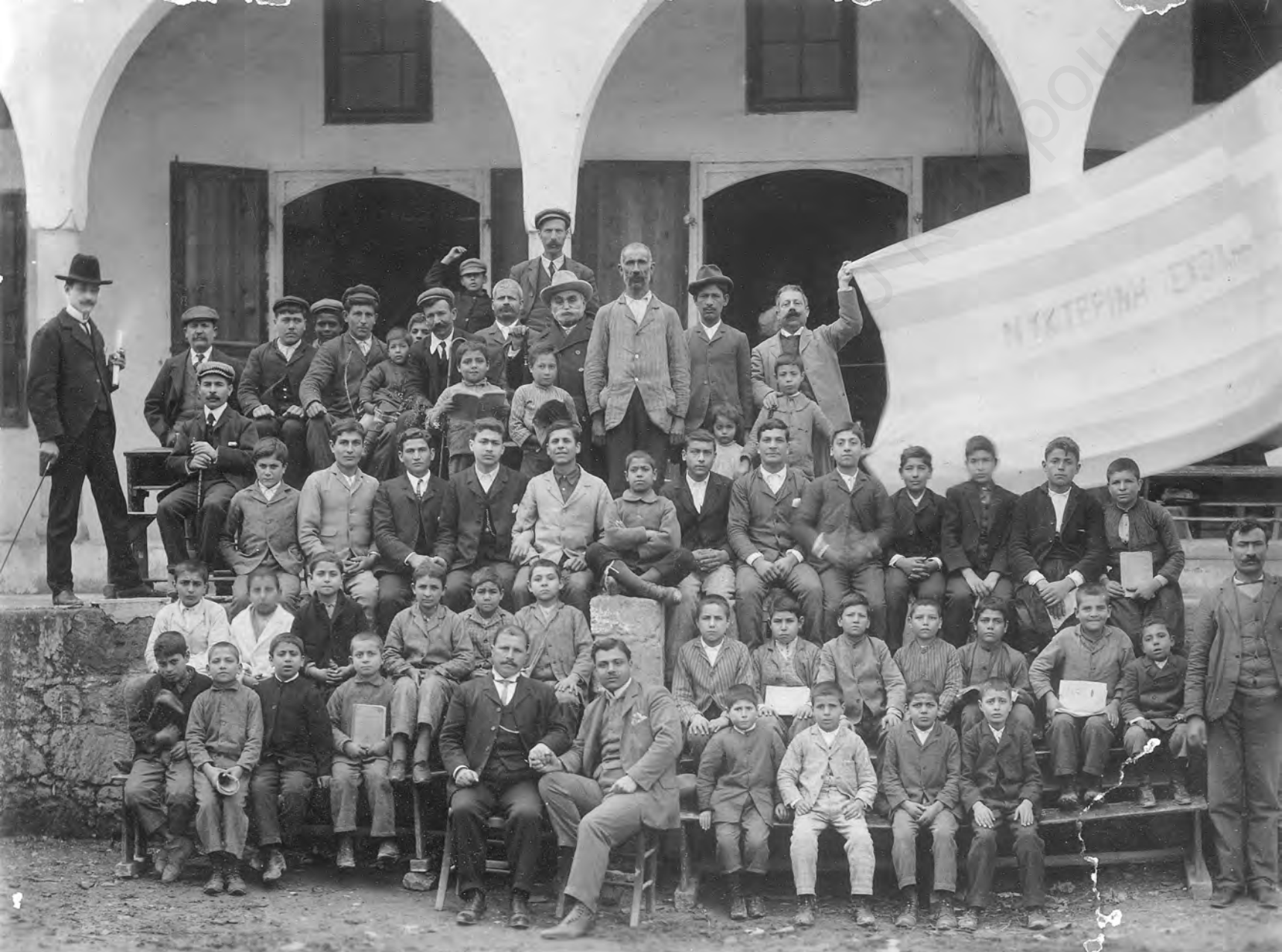
6. Μικροί μαθητές και φοιτητές της Νυχτερινής σχολής με το λάβαρό τους στο οποίο αναγράφονται οι λέξεις «ΝΥΧΤΕΡΙΝΗ ΣΧΟΛΗ», αρχές του 20ου αιώνα. (αρχείο Γιώργου Καραγιάννη).