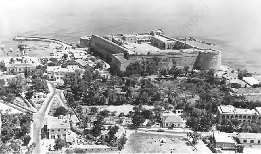
AERIAL VIEW OF KYRENIA, CYPRUS