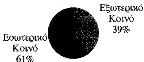
Εικόνα 1: Μέλη Βιβλιοθήκης Π. Θ.

Σήμερα εγγεγραμμένοι στη Βιβλιοθήκη του Π. Θ. είναι 7295 μέλη, εκ των οποίων οι 4424 (61%) είναι το Εσωτερικό Κοινό και οι 2871 (39%) ανήκουν στην κατηγορία του Εξωτερικού Κοινού (εικόνα 1).