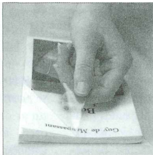
Μεμβράνη προστασίας βιβλίων

Η εταιρεία ABIO εμπορεύεται υλικά αρχειοθέτησης (φακέλους, κουτιά κ.τ.λ.) ειδικών προδιαγραφών, για την αποδοτικότερη φύλαξη των αρχείων και των βιβλίων σας.