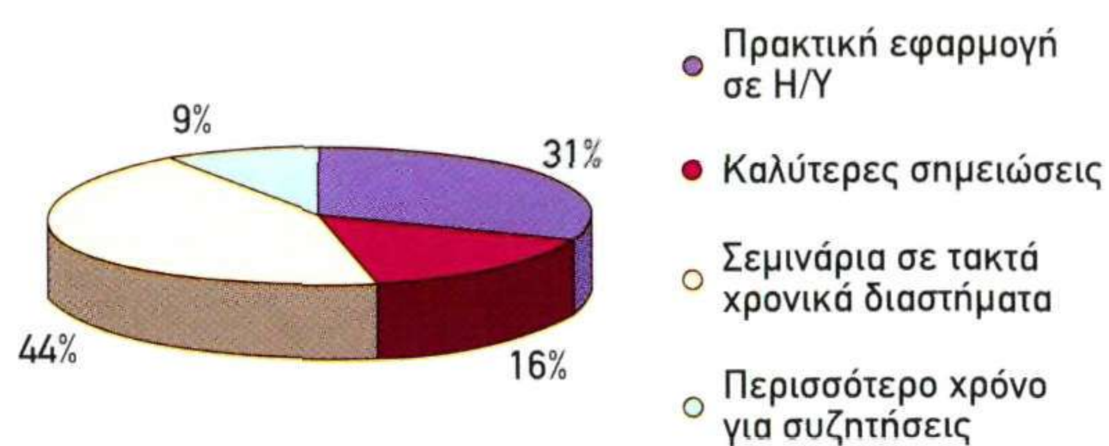
Προτάσεις - Σχόλια

Από την αξιολόγηση του ερωτήματος βλέπουμε ότι περίπου 46% των συμμετεχόντων κάνει σχόλια και προτάσεις οργανωσιακού χαρακτήρα, με κυριότερο την πρακτική εφαρμογή της διδασκαλίας. Είναι ένα ζητούμενο που η ΕΕΒΕΠ λαμβάνει σοβαρά υπόψη της και δεσμεύεται ότι σε επόμενο σχετικό σεμινάριο θα είναι σε θέση να συνδυάσει την θεωρία με την πρακτική.